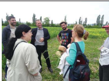
Meeting of Georgian Wheat Growers Association members in the field