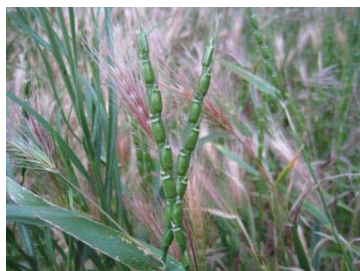
Bread wheat D genome donor Aegilops tauschii ssp. strangulata .

Currently donor of D genome, Aegilops tauschii ssp. strangulata of the bread wheat is extensively studied. This subspecies is widespread in the South Caucasus, particularly in Georgia.