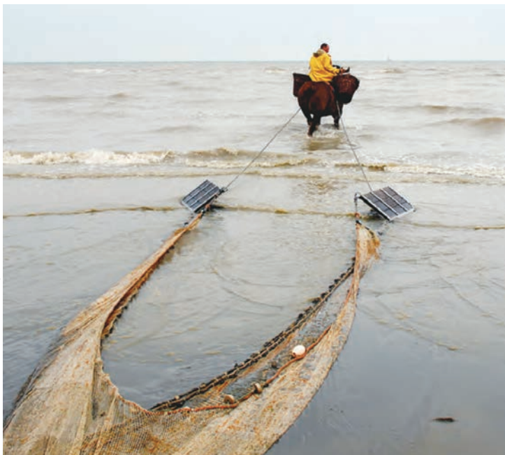
© Dirk Van Hove, Gemeente Koksijde Paardemissers_02 2007

Banyak komunitas lokal yang sudah mengembangkan gaya hidup dan praktik-praktik warisan budaya takbenda yang secara terperinci terkait dengan alam dan menghormati lingkungan hidup.