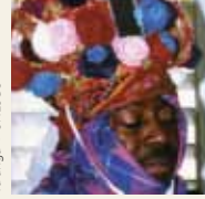
Ta'ánga © UNESCO

Garifuna-kuéra rekópe tuicha mba'eterei gueteri ko'ã teko'yma orekóva hikuái ; umi karai tuja hína oñangarekóva imbarete ha'gua ko'ã ñembo'e ha vy'aguasu yma oñembohasáva ayvu rupi.