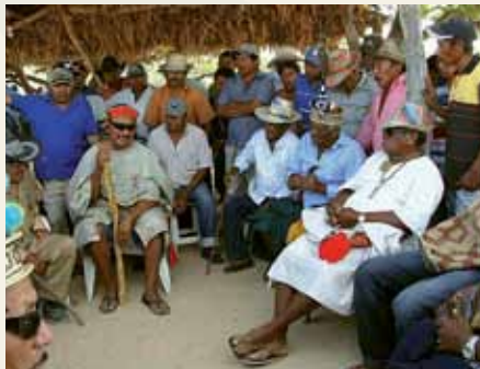
Ta'anga © UNESCO

Umi wayuus rekorã, oipurúva pūtchipũ'úi ("ñe'ëngatu") ©2009 Jayariyu-gui