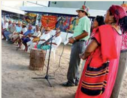
Ta'anga © UNESCO

Umi wayuus rekorã, oipurúva pūtchipũ'úi ("ñe'ëngatu") ©2009 Jayariyu-gui