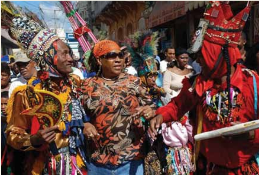
Ta'ãnga © Diego Félix

Cocolo ñoha'ãnga jeroky heñói siglo XIX mbyte rupi mba'apoharakuéra oñe'eva oupyre Karive guio ha opyta República Dominicana-pe. Pe komunida iñambuéva iñe'ë ha heko rupi omoheñói itupão, imbo'ehao ha joaju oñopytyvõ haña hikuái imba'ekueraitéva. Ñoha'ãnga jeroky ymavéva omopetei chupekuéra mamove ndojehecháigui ã mba'e. Ñepyryrã ko ñoha'ãnga oñemomirĩ ha oiko tembejugarúpe ; pe ñe'ë "cocolo" ohero umi ova pyahúva omba'apóva inglaterraygua takuare'ëndýpe upe ypa'úme ; katu ko'áña guarã opavave oguerovy'a ha ijaguara hese.