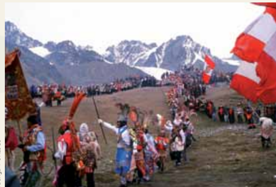
Ta'ãnga © UNESCO