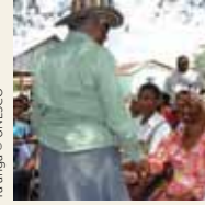
Ta'anga © UNESCO

Ombogue ha ombojevy hañua tembiapo vaicha oiporu hikuái heta símbolo, umivarã oiporu hikuái mbo'y itágui ijapopyre térã ojuka vaka, ovecha ha kavara oikuave'ë jávo hembiaapo vaikuére. Umi mba'e ivaiivaivéva ojapova'ekue rehe ikatu oikuave'ë umichagua pojoapy, oñekuave'ëva ñembo'e pevarã ojejapóva oguata aja, ha oñehenói umi ogapy oñorairõva peguakuérape jahechápa ojevy ha oiko porã jey ojoapytépe hikuái.