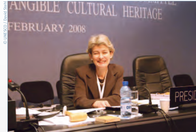
S. Exc. Mme Irina Bokova (Bulgarie), présidente de la deuxième session extraordinaire du Comité

À Sofia, le Comité a rappelé que le premier objectif de la Convention était la sauvegarde, à la fois en partenariat avec les praticiens et les autres détenteurs de la tradition et à leur bénéfice. C'est pourquoi le Comité attache une grande importance à la Liste de sauvegarde urgente, ainsi qu'à la sélection et à la promotion