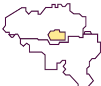
Région de Bruxelles-capitale