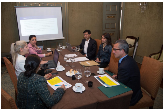
El Fondo Internacional para la Diversidad Cultural (FIDC) es una convocatoria Unesco dirigida a entidades oficiales y gubernamentales, organizaciones de la sociedad civil y organizaciones internacionales no gubernamentales (OING) vinculadas a la cultura.

Bogotá, (jun. 14/16). En el Ministerio de Relaciones Exteriores se realizó la Jornada de Deliberación y Preselección de postulantes colombianos al Fondo Internacional para la Diversidad Cultural UNESCO 2016. El Fondo tiene el objetivo de fortalecer las industrias culturales, su infraestructura institucional y el acceso a bienes, servicios y actividades culturales para los colombianos.