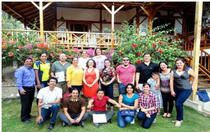
Participantes del Tercer Taller de construcción de políticas públicas para la Salvaguardia del Patrimonio Cultural Inmaterial, realizado en el marco del "Proyecto para la Salvaguardia del Patrimonio Cultural Inmaterial (PCI) del Ecuador".

El Ministerio de Cultura y Patrimonio, el Instituto Nacional de Patrimonio Cultural (INPC) y la UNESCO, a través de su oficina en Quito y Representación para Bolivia, Colombia, Ecuador y Venezuela, organizaron el Tercer Taller de construcción de políticas públicas para la Salvaguardia del Patrimonio Cultural Inmaterial, del 13 al 16 de junio de 2016, en el cantón de Puerto López, provincia de Manabí. El taller se inscribe en el "Proyecto para la Salvaguardia del Patrimonio Cultural Inmaterial (PCI) del Ecuador", financiado a través del Fondo Fiduciario Japonés para la Salvaguardia del PCI.