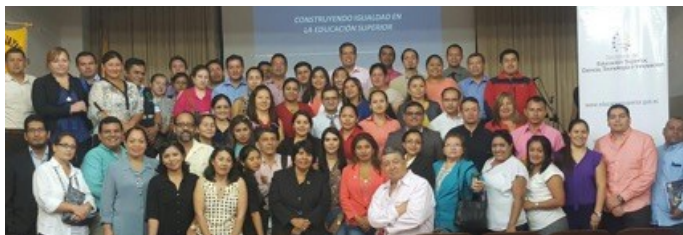
Docentes de la universidad de Guayaquil durante el lanzamiento del curso virtual en esa provincia.

El pasado 8 de marzo, a propósito del Día Internacional de la Mujer, esta Secretaría presentó en colaboración con la oficina de la UNESCO en Quito y Representación para Bolivia, Colombia, Ecuador y Venezuela, la plataforma de capacitación virtual “Construyendo Igualdad en la Educación Superior”, cuyo objetivo es fortalecer las capacidades y conocimientos de los actores de la Educación Superior para que integren la igualdad de género, discapacidad, interculturalidad y ambiente en su quehacer.