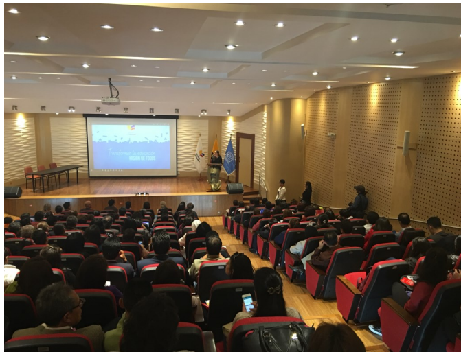
Ciclo de conferencias “Educación en contextos de emergencias: presentación de la guía de Intervención curricular en situaciones de emergencias y desastres”. Auditorio Franklin Ramírez, Ministerio de Educación, 21 de junio de 2016

Del lunes 20 y hasta el viernes 24 de junio de 2016, se llevaron a cabo en Ecuador una serie de actividades, coordinadas y planificadas por el Ministerio de Educación, junto con la Oficina de UNESCO en Quito y Representación para Bolivia, Colombia, Ecuador y Venezuela y con el apoyo de UNICEF y del proyecto DIPECHO “Más educación menos riesgos” -cuya ejecución en Ecuador está a cargo de Plan Internacional-, con el objetivo de “generar un proceso de diagnóstico, intercambio de experiencias internacionales, diseño conjunto de una política pública para formación docentes en materia de Educación en Emergencia y evaluación del proceso; del que participen los tomadores de decisiones del Ministerio de Educación para generar capacidades en docentes, personal administrativo y directivos de las instituciones educativas del Ecuador”.