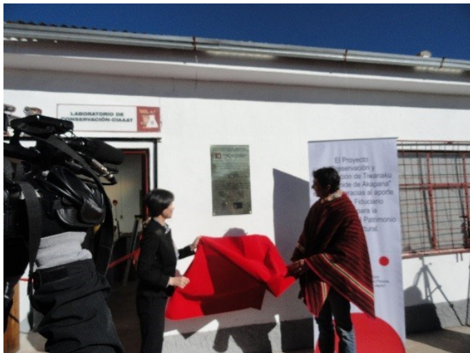
Kioko Koga, Embajadora de Japón en Bolivia y Marko Machicao, Ministro de Culturas y Turismo de Bolivia, develan la placa de la inauguración del Laboratorio de Conservación del CIAAAT.

Las contrapartes del proyecto se reunieron el 21 de junio en el sitio de Tiwanaku, en el marco de la significativa celebración del Wilkakuti (Año nuevo aimara), para inaugurar y realizar la entrega oficial del Laboratorio de Conservación del Centro de Investigaciones Arqueológicas, Antropológicas y Administración de Tiwanaku (CIAAAT), a las autoridades de ese centro y del Ministerio de Culturas y Turismo del Estado Plurinacional de Bolivia.