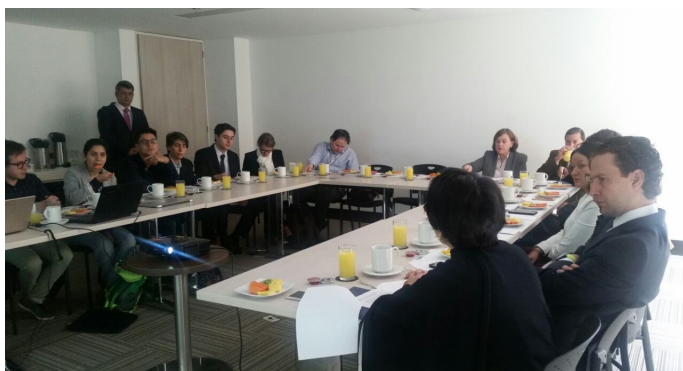
Durante el desarrollo de la mesa de trabajo convocada en el marco del Día Mundial de la Libertad de Prensa.

En el marco del Día Mundial de la Libertad de Prensa, celebrado cada 3 de mayo, esta Oficina auspició, junto con la FLIP de Colombia, la iniciativa de generar espacios de reflexión con el objetivo de estimular una discusión propositiva que permita cualificar el debate acerca de asuntos centrales para la libertad de prensa en el postconflicto, tales como la regulación de la pauta oficial, las condiciones de los medios públicos y comunitarios, así como la concentración de los medios de comunicación.