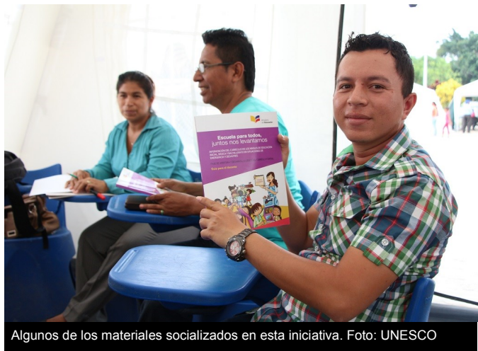
Algunos de los materiales socializados en esta iniciativa.

La iniciativa fue organizada por la Oficina de la UNESCO en Quito, junto a la Oficina Regional de Educación para América Latina y el Caribe (OREALC/UNESCO Santiago), el Ministerio de Educación del Ecuador y con el apoyo del Proyecto DIPECHO “Más educación, menos riesgo”.