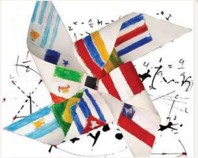
Se realizó el X Congreso Iberoamericano de Indicadores de Ciencia y Tecnología de la RICYT, con participación de la UNESCO

Diálogo entre productores y usuarios de información”