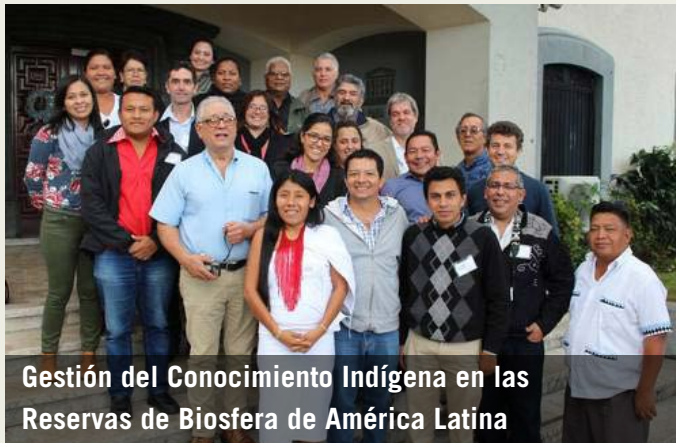
Gestión del Conocimiento Indígena en las Reservas de Biosfera de América Latina