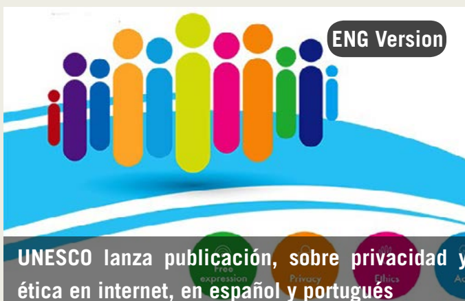
UNESCO lanza publicación, sobre privacidad y ética en internet, en español y portugués