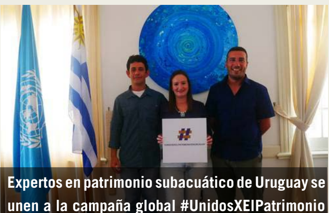
Expertos en patrimonio subacuático de Uruguay se unen a la campaña global #UnidosXEIPatrimonio