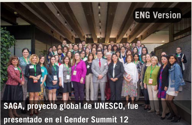
SAGA, proyecto global de UNESCO, fue presentado en el Gender Summit 12