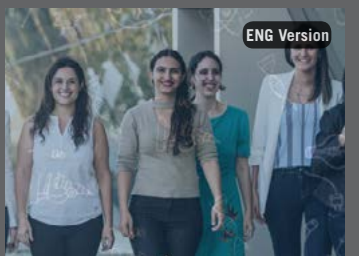
UNESCO Brasilia - Prêmio L'Oréal-UNESCO-ABC Para Mulheres na Ciência abre inscrições para a 13ª edição