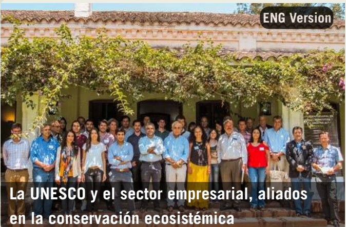
La UNESCO y el sector empresarial, aliados en la conservación ecosistémica

Diálogo entre productores y usuarios de información”