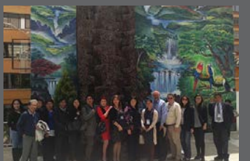
UNESCO Quito - Ciencia, Tecnología, Innovación y Diálogo de Saberes en los Países Andinos