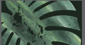
UNESCO México presenta la publicación “La Conservación del Bosque Tropical”, diálogo multidisciplinario sobre un tema de debate mundial