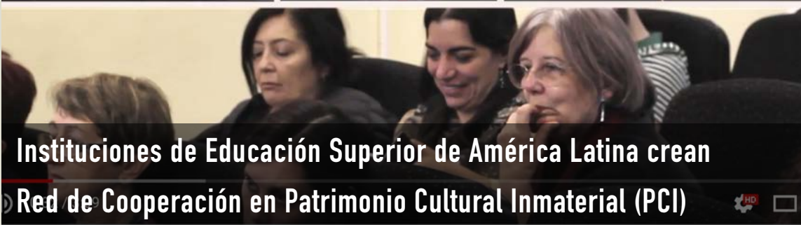
Instituciones de Educación Superior de América Latina crean Red de Cooperación en Patrimonio Cultural Inmaterial (PCI)