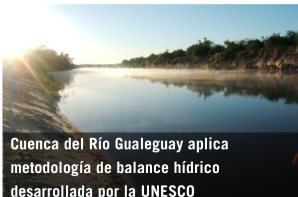
Cuenca del Río Gualeguay aplica metodología de balance hídrico desarrollada por la UNESCO