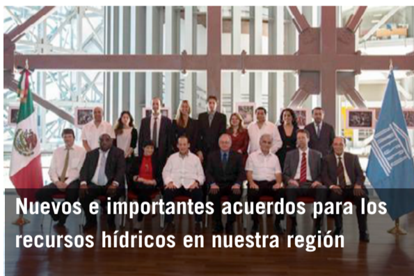
Nuevos e importantes acuerdos para los recursos hídricos en nuestra región