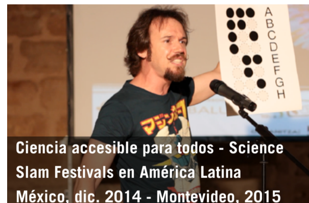
Ciencia accesible para todos - Science Slam Festivals en América Latina México, dic. 2014 - Montevideo, 2015