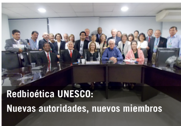
Redbioética UNESCO: Nuevas autoridades, nuevos miembros