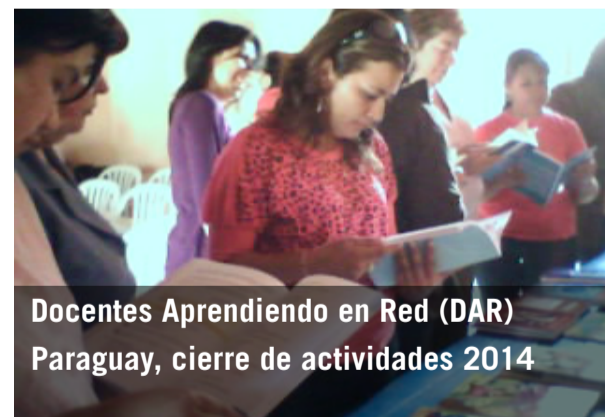
Docentes Aprendiendo en Red (DAR) Paraguay, cierre de actividades 2014