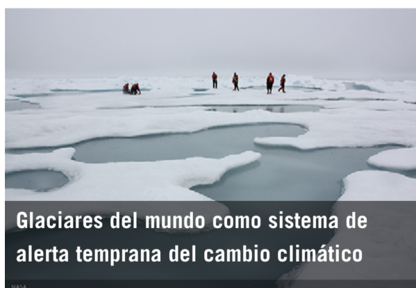
Glaciares del mundo como sistema de alerta temprana del cambio climático