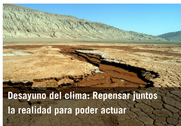
Desayuno del clima: Repensar juntos la realidad para poder actuar