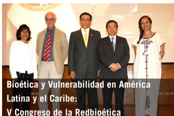
Bioética y Vulnerabilidad en América Latina y el Caribe: V Congreso de la Redbioética

Culminó con éxito el Desayuno del Clima ¿Cómo incorporar el conocimiento científico en la gestión pública y privada? convocado por el Centro Regional de Cambio Climático y Toma de Decisiones, e impulsado conjuntamente por la UNESCO y Fundación AVINA en el marco de la COP20.