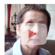
Bioética y Derechos Humanos: la visión latinoamericana