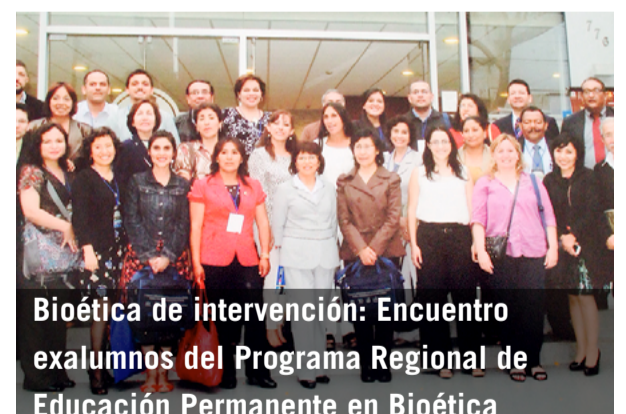
Bioética de intervención: Encuentro exalumnos del Programa Regional de Educación Permanente en Bioética