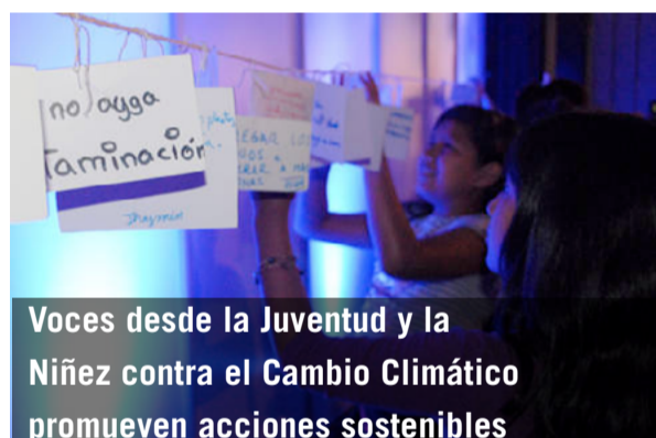
Voces desde la Juventud y la Niñez contra el Cambio Climático promueven acciones sostenibles