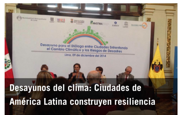
Desayunos del clima: Ciudades de América Latina construyen resiliencia