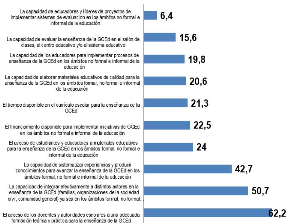
Gráfico 4: Cuáles son los principales retos en la implementación de programas de GCE