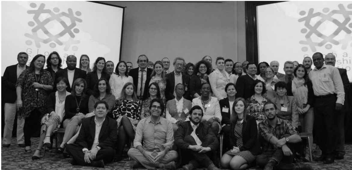
Participantes del foro en Santiago.

En este marco, la UNESCO desarrolla el enfoque de Educación para la Ciudadanía Mundial (Global Citizenship Education, GCED en inglés), como un ámbito educativo estratégico cuya conceptualización y metodologías de implementación fueron discutidas a nivel mundial mediante la implementación de procesos de consulta 2 llevados adelante con múltiples actores a nivel internacional y regional, y la organización de foros mundiales 3 entre 2013 y 2015 para promover la discusión e intercambio de experiencias sobre la temática. Estas actividades contribuyeron a avanzar en la generación de conocimiento sobre este tema, en su discusión, así como también en el desarrollo de un estado del arte sobre su situación en el mundo. En este último aspecto, se ha fomentado la diseminación y discusión sobre percepciones de distintos actores de la educación sobre este concepto, sus metas, las competencias que debe desarrollar y su relación con ámbitos temáticos claves como la educación en derechos humanos, la educación ciudadana, la educación para la sostenibilidad medioambiental, la educación intercultural, entre otros.