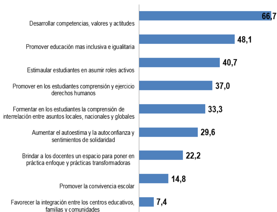
Gráfico 3: Metas más prioritarias para la Educación para la Ciudadanía Mundial en el curriculum escolar