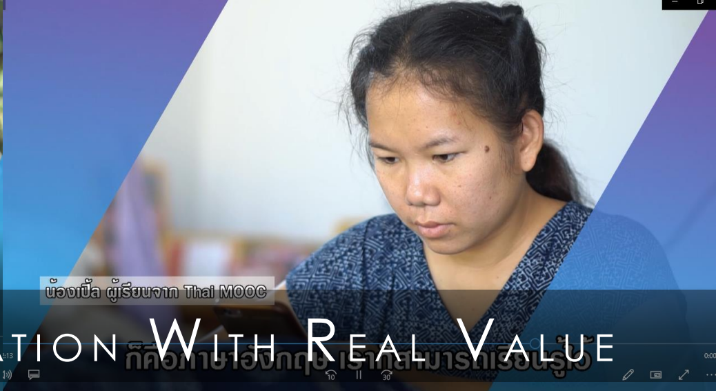
PLE entrepreneur thai mooc