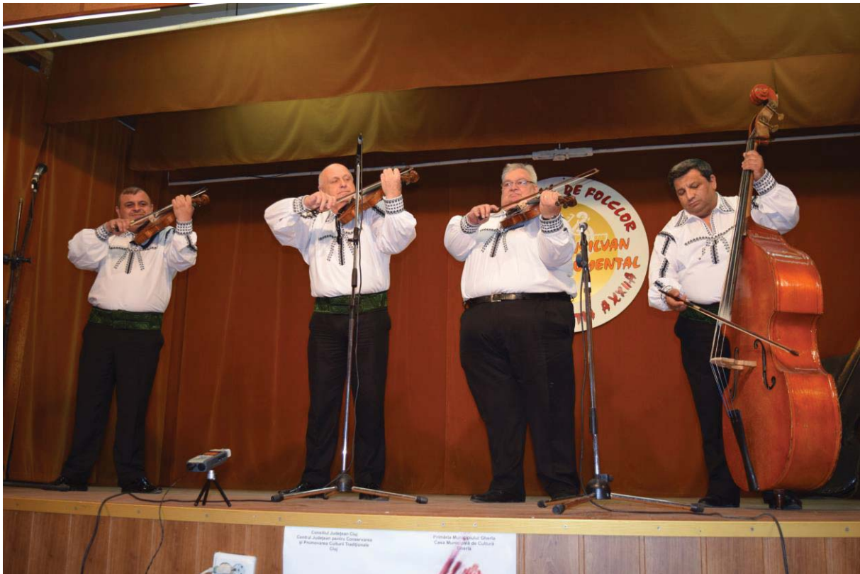
Taraful LELIȚA DE LA CĂSTĂU (Hunedoara)