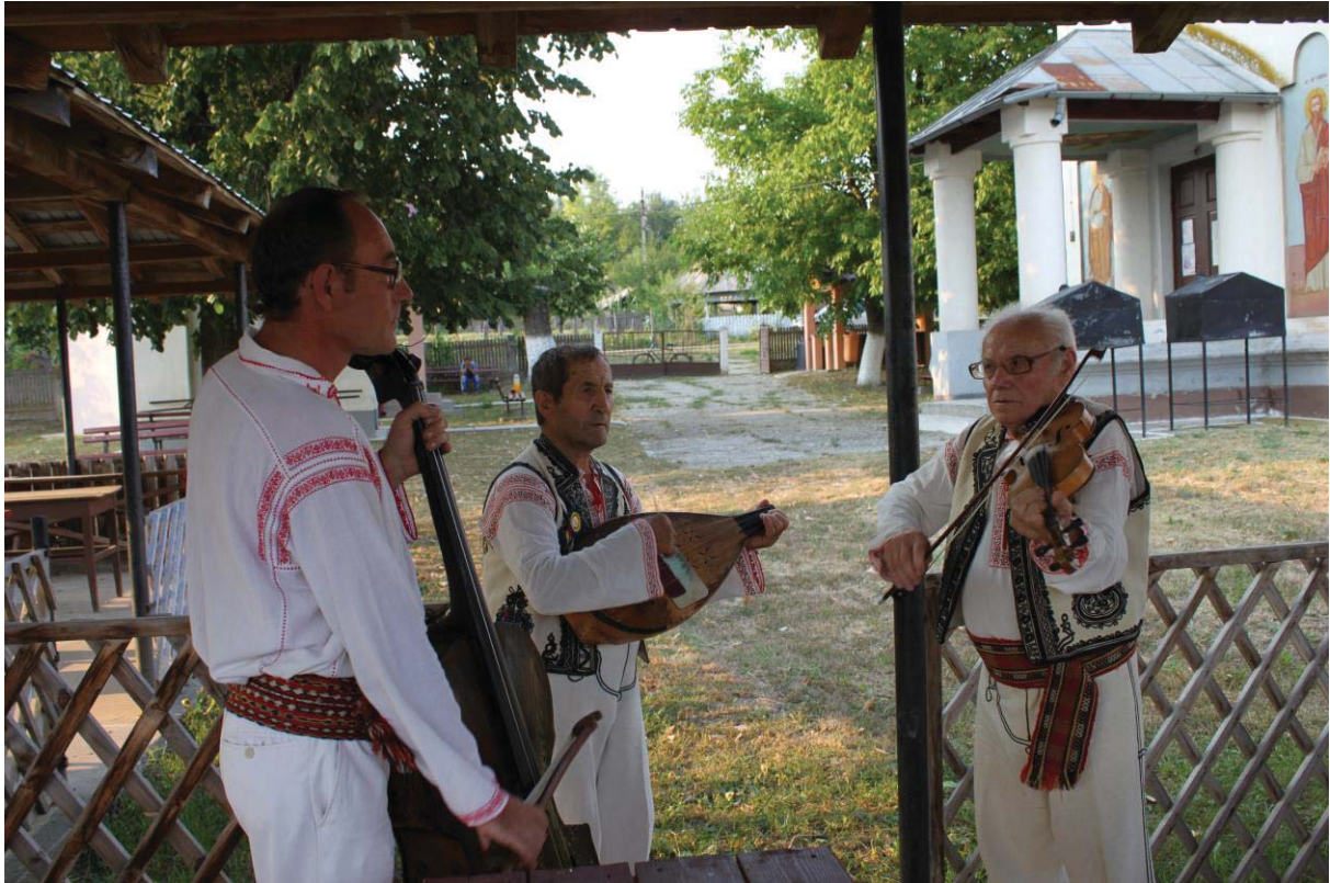
Taraful din Grecești (Dolj)