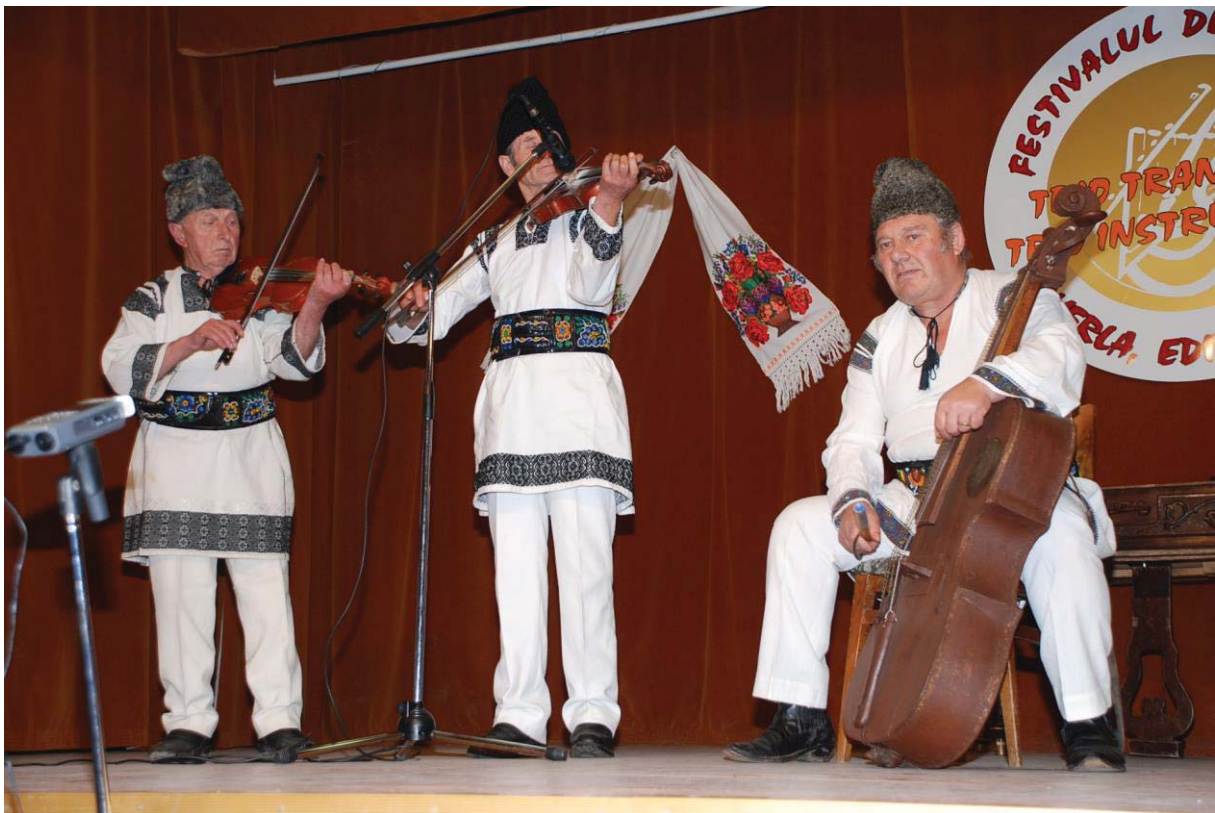
Trio IZVORASUL din Gălăuțași (Harghita)