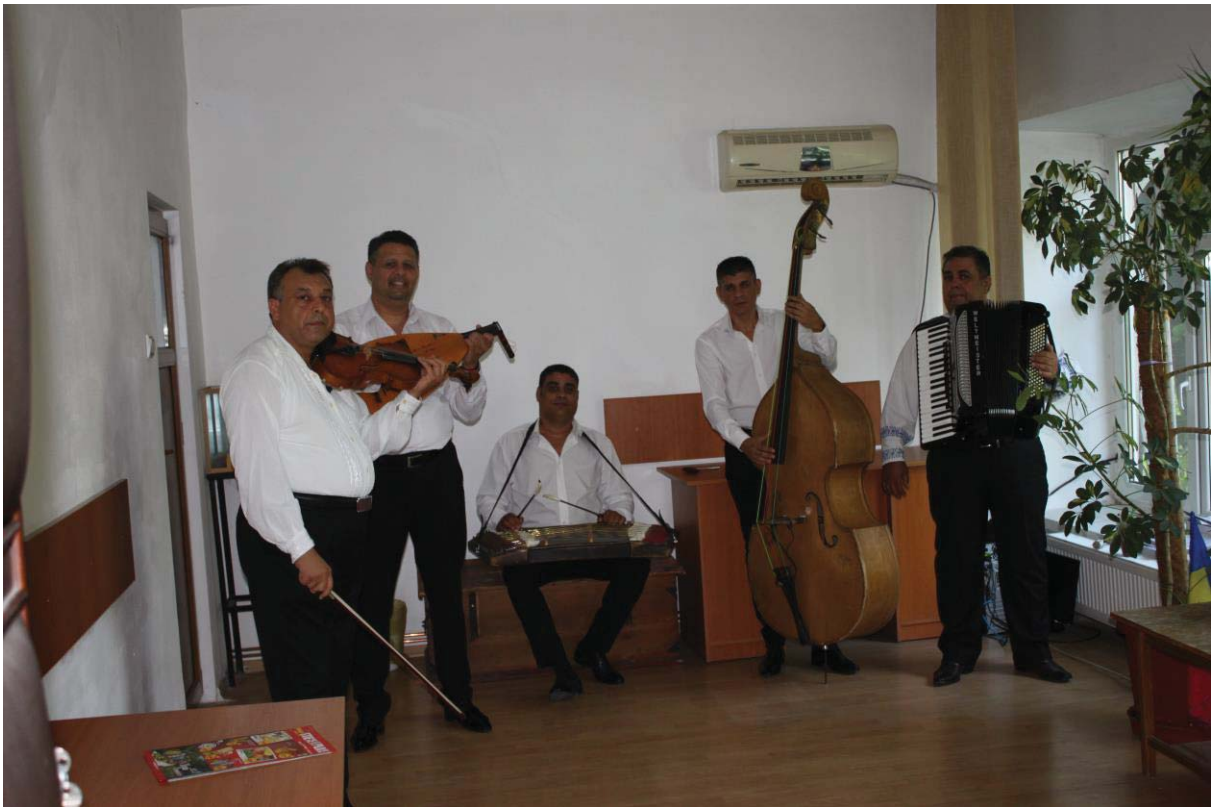
Taraful Burnasul din Alexandria (Teleorman)