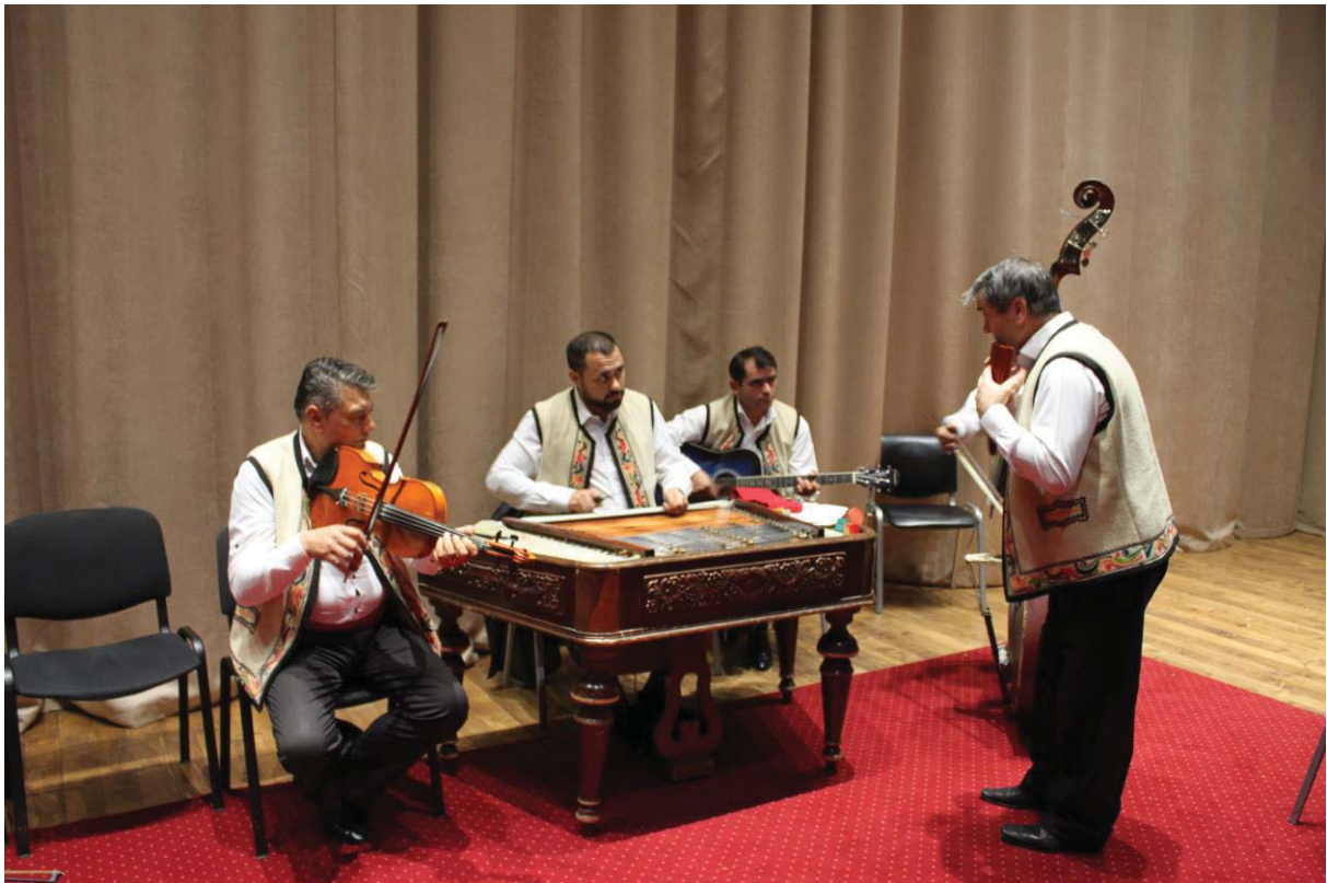
Taraful RAPSODIA VÂLCEANĂ (Vâlcea)