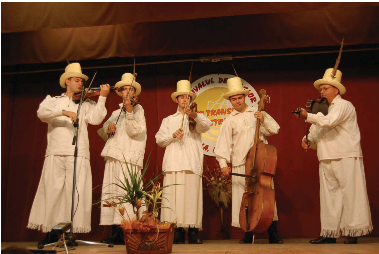
Trio transilvan IEDERA din Carei (Satu Mare)