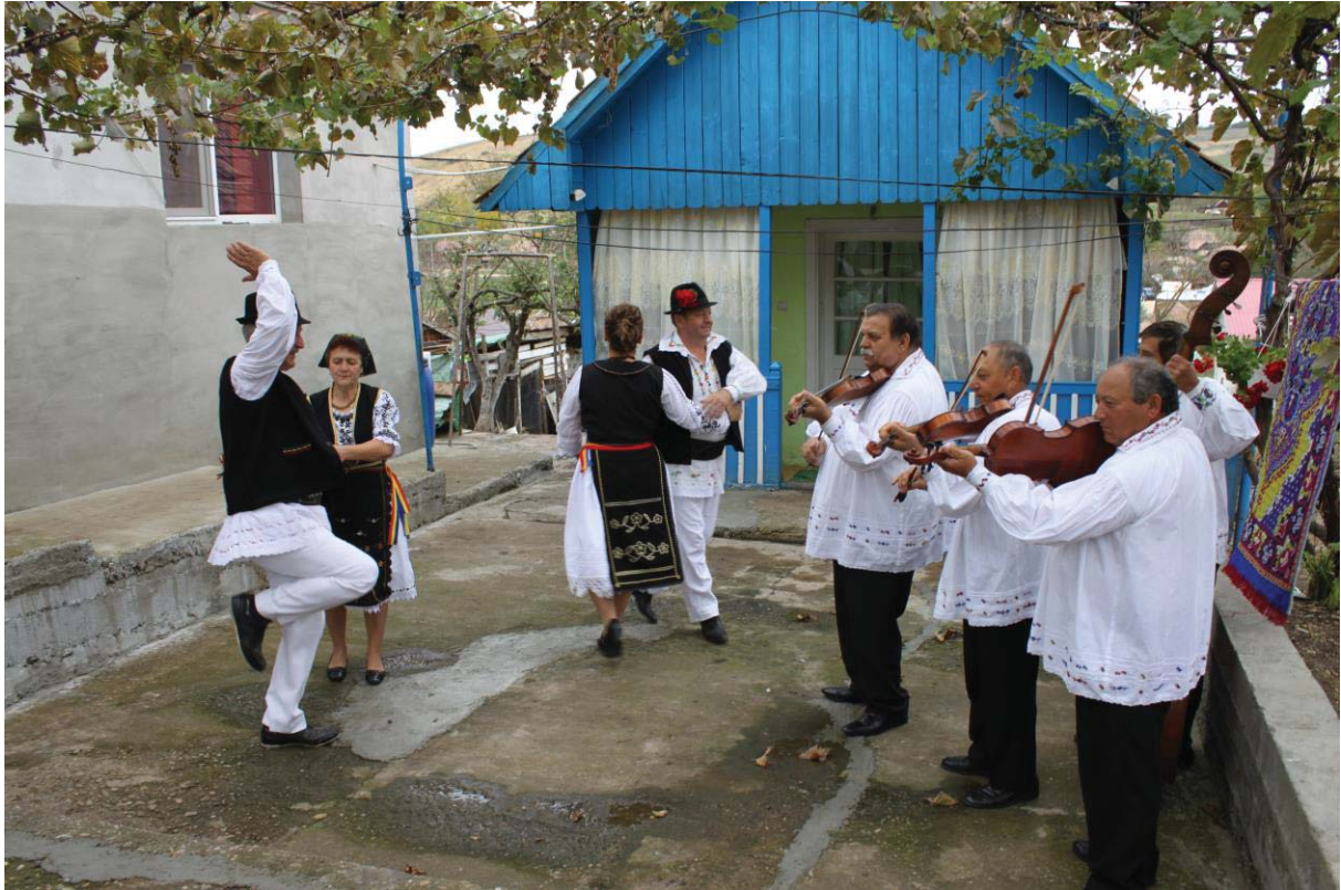
Taraful lui Șandorică din Soporu de Campie (Cluj)