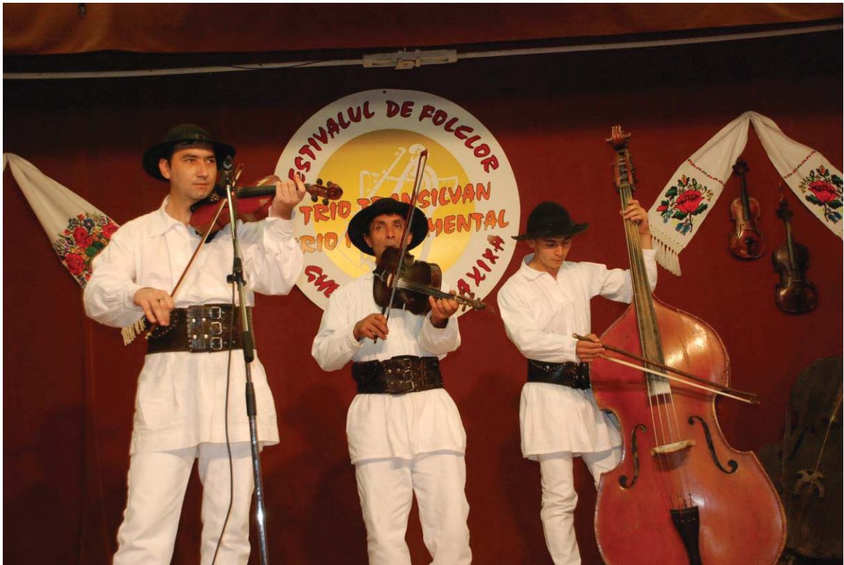
Trio PAUNITA din Sângeorz Băi (Bistrița-Năsăud)