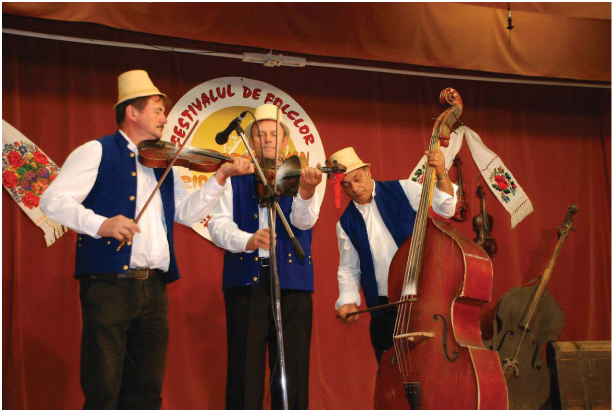
Trio din Sic (Cluj)