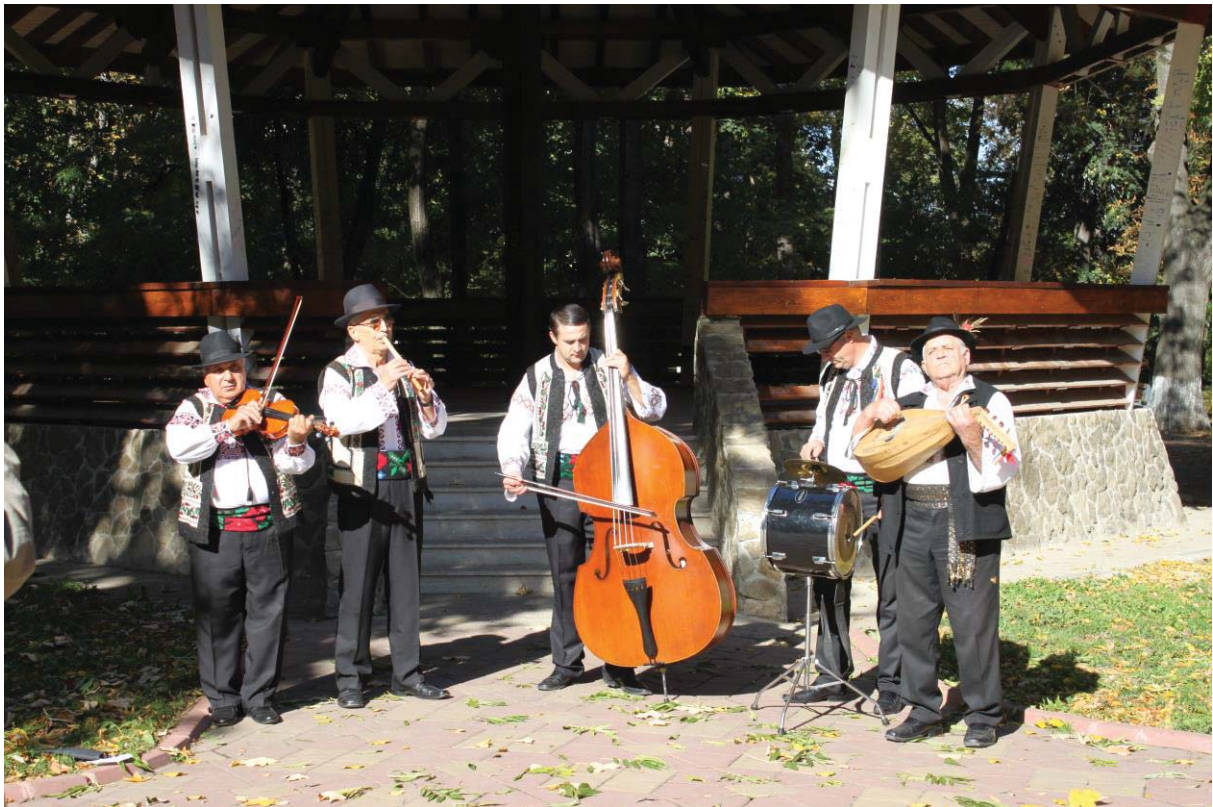
Taraful DOINA SIRETULUI (Botoșani)