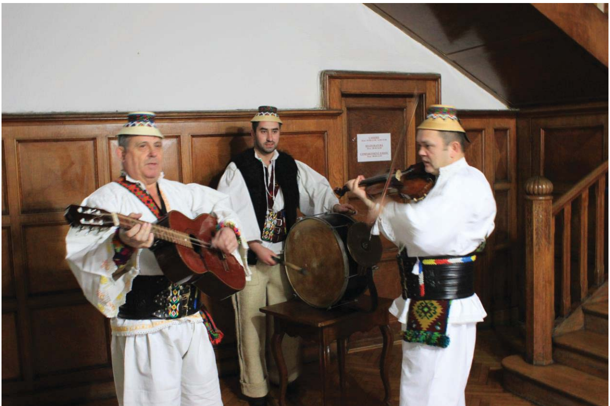
Grupul IZA din Hoteni (Maramureş)