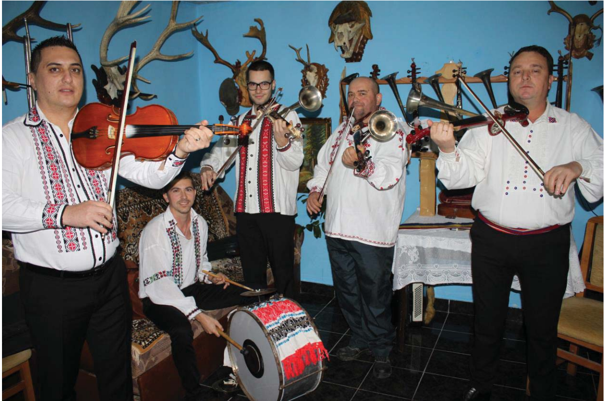
Hididișii cu goarna din Cihei (Bihor)