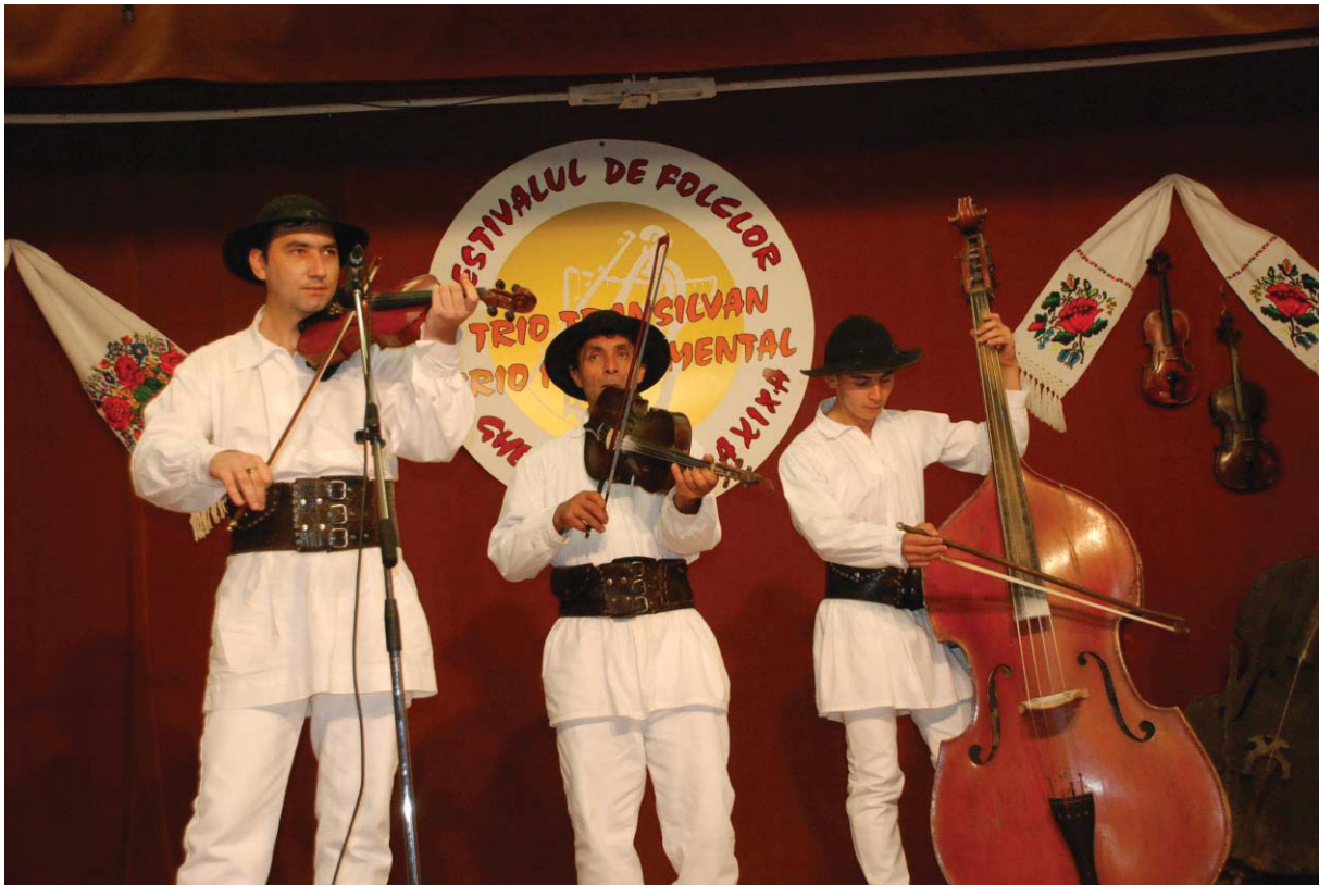
Trio PAUNITA din Sângeorz Băi (Bistrița-Năsăud)