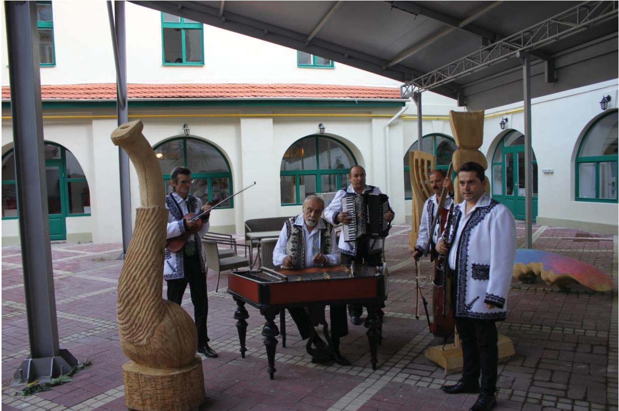
Taraful Banatul din Timișoara (Timiș)