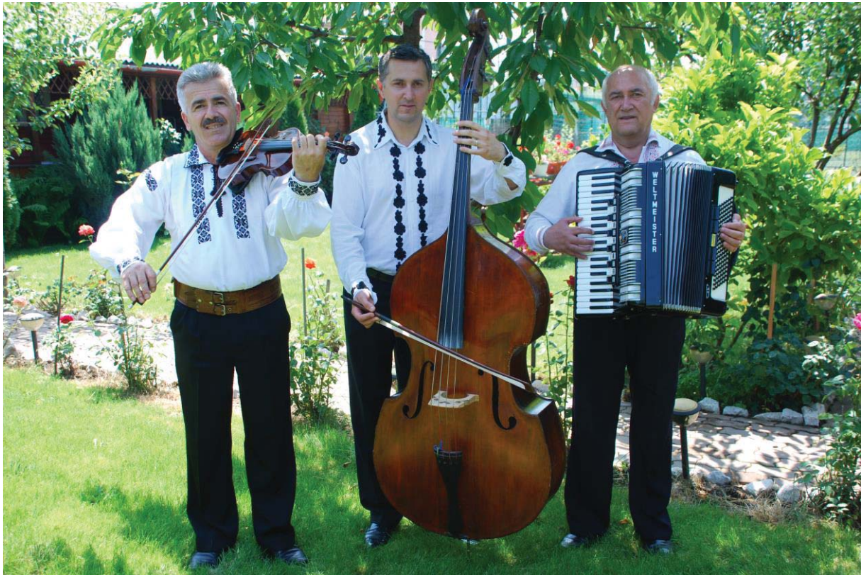
Trio BOCA din Gherla (Cluj)