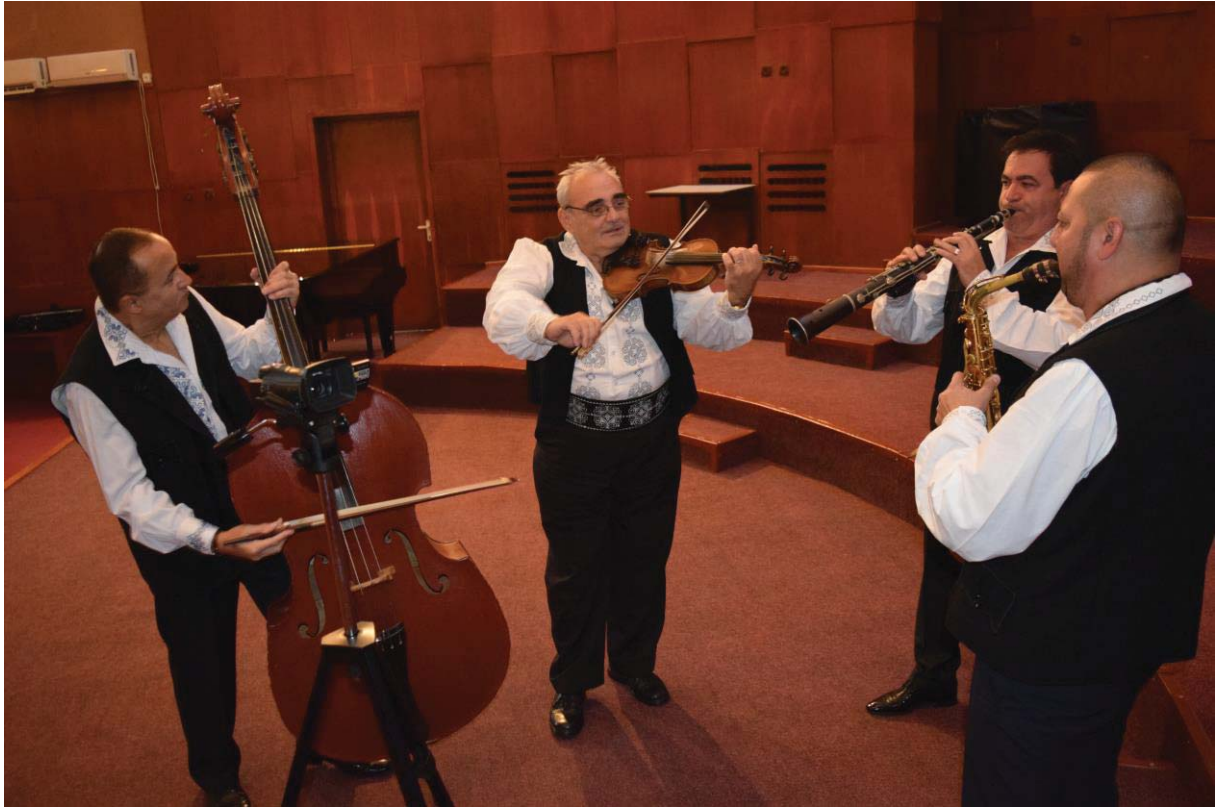
Taraful VIRTUOZII SEMENICULUI (Caraș-Severin)