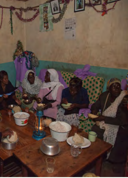
© युनेस्को । इज्याक अमोरो २०११