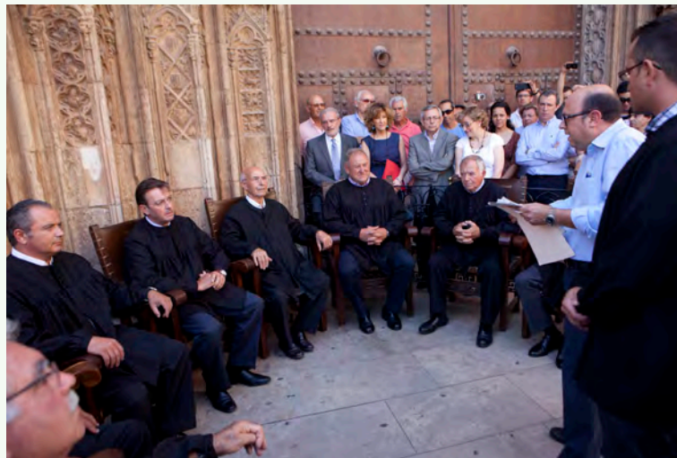
© ट्राइवुनल डी लस अगाउस डि ला भेगा डि भ्यालेन्सिया

समयाक्रममा संकलित ज्ञान तथा अभ्यासहरूलाई प्राकृतिक स्रोतको दिगो प्रयोग र जलवायु परिवर्तनका असरहरूलाई कम गर्न प्रयोग गरिएको छ । अमूर्त साँस्कृतिक सम्पदाले यसरी जैविक विविधता संरक्षण गर्न सहयोग गर्न सक्छ र वातावरणीय दिगोपनामा योगदान पुर्‍याउन सक्छ ।