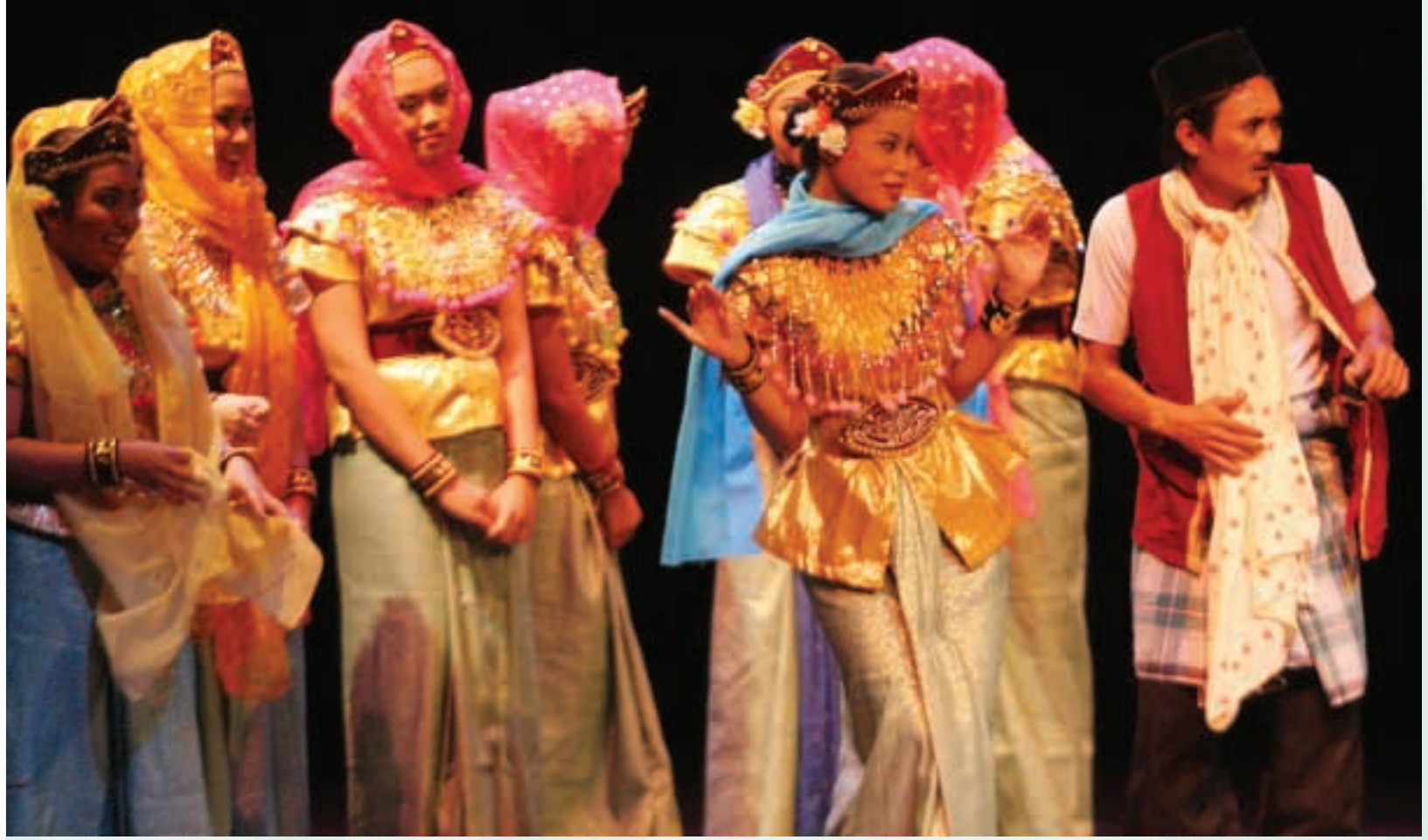
مسرح ماك يونغ، ماليزيا

زادت عن ٢٥.٠٠٠ دولار أمريكي، أو البرامج والمشروعات والأنشطة المذكورة في المادة ١٨ من الاتفاقية. وترد معايير اعتمادها والإجراءات الخاصة بذلك في الفصل الثالث من التوجيهات التنفيذية.