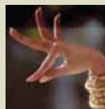
Taqinina Waqaychata Aphalla Yänaka

yänakaru yanapañatakixa janiwa wakisiriki. Uka aski yänakaxa yaqha yaqha uñstiri, mayja thakhinakani ukhamawa. Ukhamäpanxa, patrimonio cultural inmaterial taqi jani uñjkaya jani llamkht'kaya yänakaxa ayllunkirinakana uñstayatapanxa jaqinakapana jakayataskiwa, jupanakarakiwa thuquhuñanakapampi chika, jaylliñanakapampi chika, qullasiñanakapampi chika sarantayaskapxi, jani ukhamkaspa ukjaxa niyasa mayjt'awayxaspawa. Ukhamarusa, ayllupana jakasirinakapaxa, patrimonio cultural inmaterial taqi jani uñjkaya jani llamkht'kaya yänaka jupanakawa niya taqpachani utt'ayasaxa jakayaskapxi, khitinkapunisa mä kunasa ukaxa janiwa sumpacha yatiñjakiti.