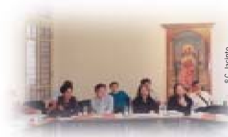
Participantes en el seminario de Montevideo

mayor motivación y variadas oportunidades de aprendizaje.