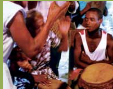
☞ (Colombia) Palenque de San Basilio uksana yatijnachaaqapa

ch'amanchatañapa, ayllunakasa tama tama jaqinakasa Estado Parte ukankirikamakiwa. Taqita sipanxa, jani uñjkaya jani llamkht'aya yānaka jakhthapiñanxa jani walt'añanakaxa taqiniru yāqasa jan'aki askichatañapa qhananchatañapawa. Convención qillqatanxa aka jakhthapiñaruxa pachpa ayllunkirinakana yanapt'añapatakiwa ch'amanchapxi. Ukata qhiparuxa lakinuqaña, kawkhakama puriña, qhawqhanisa, waqaychaña, taqi ukanaka pachpa Estado ukana irnaqirinakawa "pachpana jakasiñapa uñakipasaxa" sumpacha amuyt'asa wakisiyapxañapa.