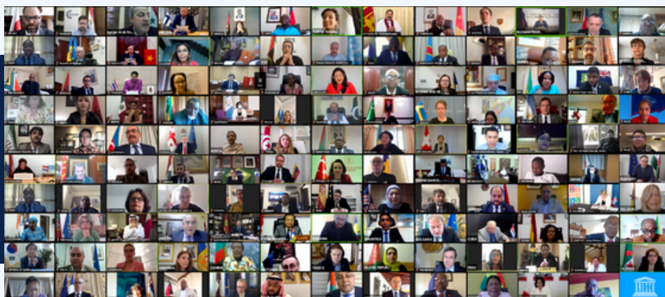
Réunion en ligne des ministres de la culture de l'UNESCO, 22 avril 2020

M. ZHANG XU, VICE-MINISTRE DE LA CULTURE ET DU TOURISME DE LA CHINE