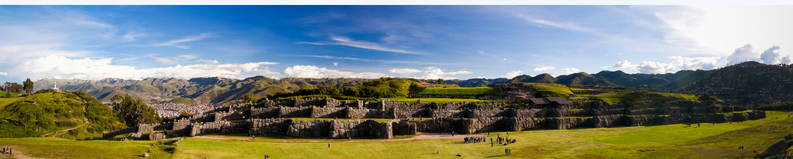
Vue de Sacsayhuaman, Site du Patrimoine mondial de l'UNESCO, Cuzco, au Pérou

L'organisation de protection des grands félins Panthera a enregistré une recrudescence du braconnage des grands félins en Colombie, avec la mise à mort de deux jaguars, d'un ocelot et d'un puma ces dernières semaines. Début avril, au Cambodge, trois ibis géants en voie d'extinction ont été tués pour leur viande, suite à l'effondrement de l'industrie touristique locale. Bien que la Commission de la justice pour la vie sauvage (traduit de l'anglais : Wildlife Justice Commission) a signalé que les réseaux de trafic ont été temporairement interrompus par les restrictions imposées aux voyages internationaux, la Commission met en garde sur la probabilité d'une ouverture prochaine de nouvelles routes.