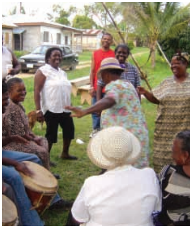
Language, Dance and Music of the Garifuna