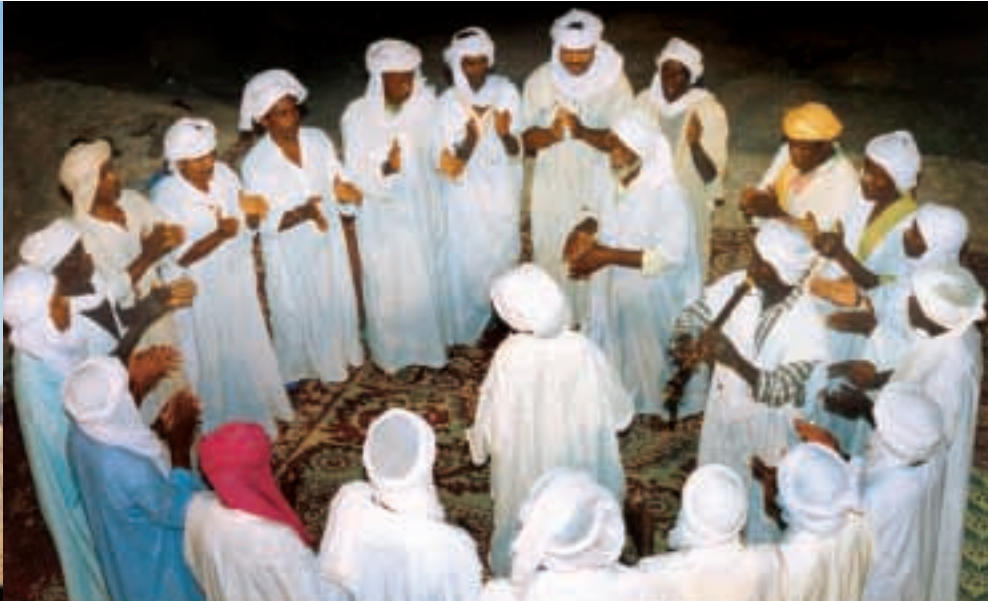
الباتوم في بيرغا، إسبانيا