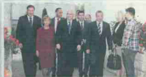
Državni dužnosnici na otvorenju Festivala čipke