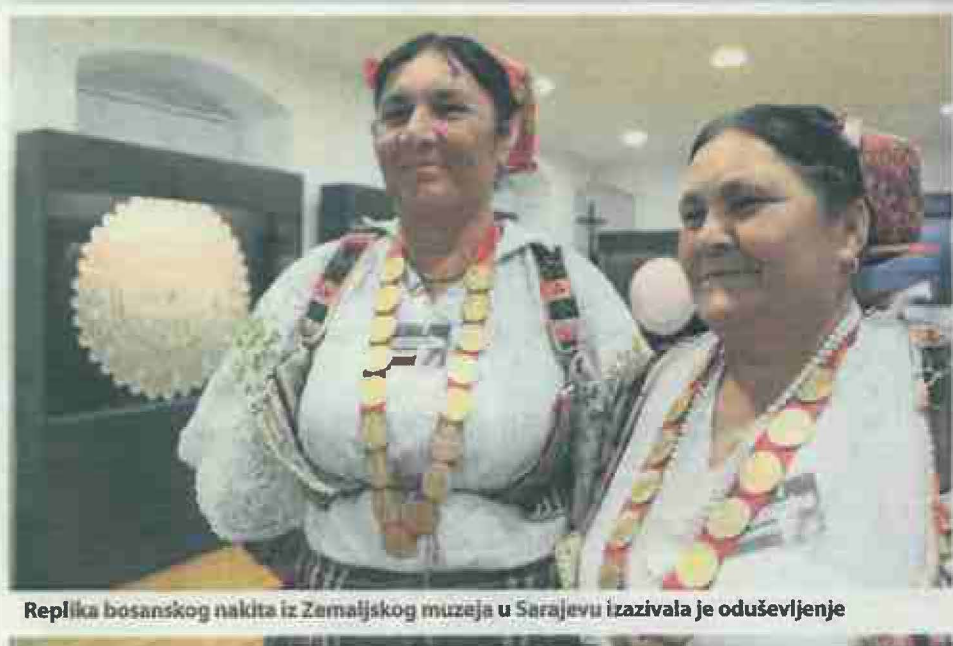
Replika bosanskog nakita iz Zemaljskog muzeja u Sarajevu izazivala je oduševljenje