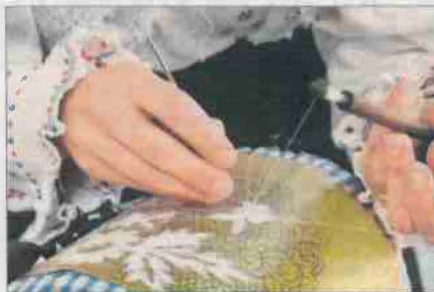
Lepoglavska čipka na popisu je svjetske nematerijalne baštine UNESCO-a

na koji način pristupaju suodnosu čipke i nakita. Svoje će radove izložiti Zadruga lepoglavske čipke, Udruga ekomuzeja Lepoglava i Čipkarsko društvo Danica Brösslen