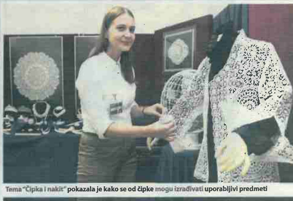
Tema "Čipka i nakit" pokazala je kako se od čipke mogu izrađivati uporabljivi predmeti