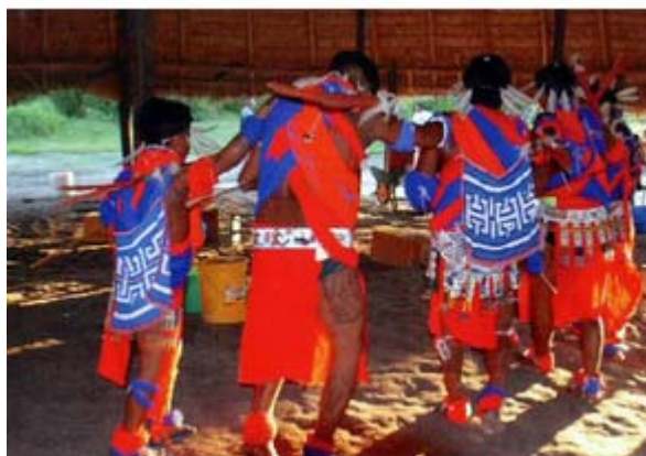
Musiques et danses