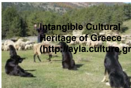
Intangible Cultural Heritage of Greece ( http://ayla.culture.gr/en/ )