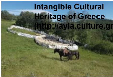
Intangible Cultural Heritage of Greece ( http://ayla.culture.gr/en/ )

( http://ayla.culture.gr/wp-content/gallery/metakinoumeni_ktinotrofia_agglika/%CE%95%CE%B9%CE%BA