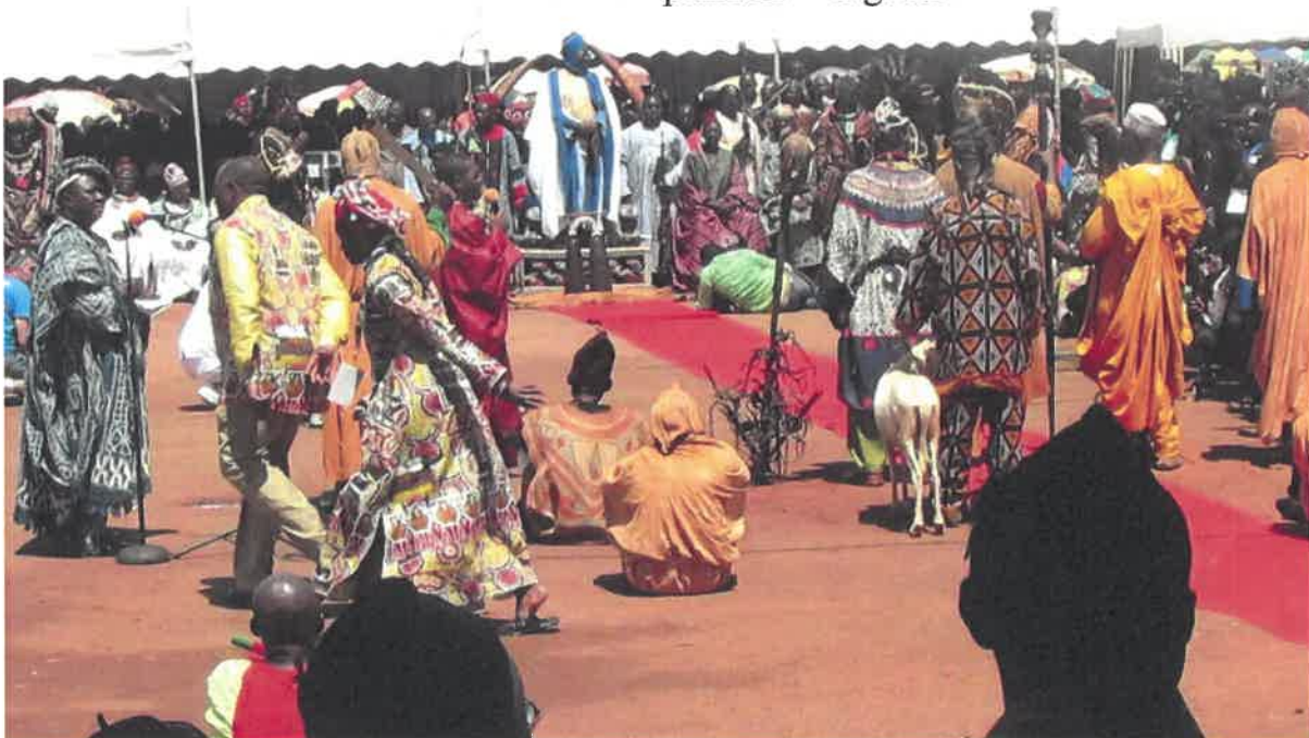
Sortie du "Kù-Mùtngu" ou lance de justice du musée et bœuf pour le sacrifice après le jugement du Roi