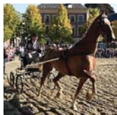
INTANGIBLE HERITAGE Relief of Groningen (/en/groningensontzet)