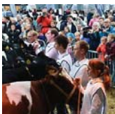
INTANGIBLE HERITAGE Cow Market in Woerden (/en/koeimartwoerden)