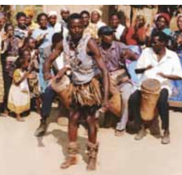
Ta'anga © François-Xavier Frelaud / UNESCO

Jahechápa ikatu haguéicha umi inventario ombyaty heta patrimonio, Estado-kuéra ikatu ombohasa marandu mbykymimi ombosako'íkuévo ko tembiporu. Oíta katuetei ningo patrimonio oikotevëtava oñeñangarekove