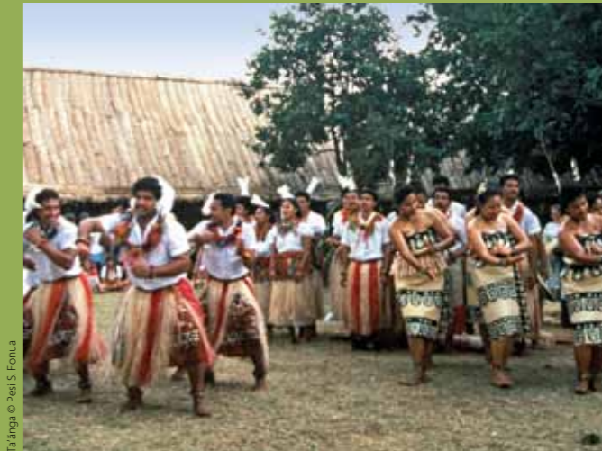
Ta'anga © Presi S. Fonua