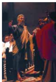
Ta'anga © Jaime Brotons

Las fiestas indígenas dedicadas a los muertos, México