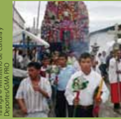
Ta'anga © Ministerio de Cultura y Deportes/GMA PRO