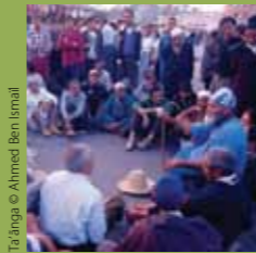
Ta'anga © Ahmed Ben Ismail

Tekopy tee ojehechakuaa'ýva, oñembohasa oúvo sy ha túvagui imembýpe, ha'e kóva ombohasa jey oúvo iñemoñarépe ningo tapichakuéra akóinte ombopyahu oikokuévo ojoapytépe, oku'évo pe hekohápe ha péicha omboheko ha omboguatave ohóvo; ha'e omopetei, omoambue ha oipysó komunida ha tapichakuéra reko, ha péicha ombohape oñemomba'évévo opaichagua teko ha tapicha apytu'úroky oíva.