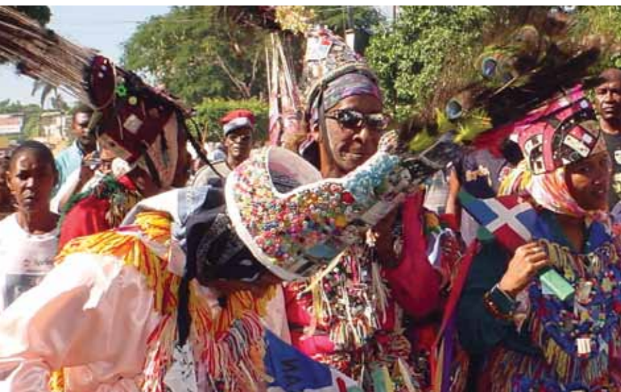
Ta'anga © Juan Rodríguez Acosta