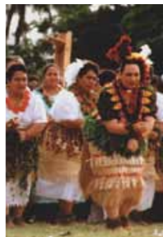
Ta'anga © Pesi S. Fonua