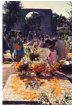
Ta'anga © Sublección de Etnografía, Museo Nacional de Antropología

Pe ñembyaty ha ñongatu he'ise oñembyaty umi Tekopy tee ojehechakuaa'yva oñe'eva ha oñemo'í kuatia ári hekópe porã jahechápa opavave oreko hesa renondépe. Heta hendáicha oñembyaty ha oñeñongatukuaa ko'ã mba'e, heta hendáicha oñembohete'eva, ha oñembyatyve arandukakoty terã web roguépe hamba'e, ikatuhápe mayma tapicha ovichease oíke oje'opyvy ha oikuaa. Katu iporãne oje'okuaa komunida ha tapichakuéra aty orekoha avei mba'éichapa oñongatu hekopekuéra umi mba'e porã orekóva, umíva ikatu puraheiryru, ñembo'e, tejido, ta'anga terã ambueve tembiporu hamba'e añetehápe he'iséva heta mba'e ha ombyatyva avei arandu Tekopy tee ojehechakuaa'yva rehegua.