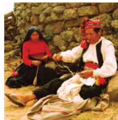
Ta'anga © Instituto Nacional de Cultura / Dante Milafuente

Convención Artículo 11 ningo he'í Estado Pypegua ojapova'erãha tekotevêva ikatu hağuaícha oñangeko añetehápe Tekopy tee ojehechakuaa'yva oiva ijyvy'pe, ha tombokatu jahechápa komunida, atykuéra ha organización ndaha'éiva tetã rekuaipegua oike ojuhu ha omohendávo mba'e oiva Tekopy tee ojehechakuaa'yva ryepy'pe. Jeyuhu he'ise mba'e oñembohatáva oñehakã'í'o hağua peteĩ téra hetave umi patrimonio cultural inamterial rakanguéra hekohápe ha oñemoambue ambuekuéragai. Ko tembiapo ojejuhu ha ñehakã'í'o ningo hína Convención oheróva "tembijohukue ñembokuatia, ojesasegura potávo ñangareko"; péva he'ise pe juhupyte ñembokuatia ndaha'éiva ku oikóva amo yvate, síno añetehápe oikóva ha ojehecháva. Upéicharõ, oiméramo ojehechakuaa'ra'e Tekopy tee ojehechakuaa'yva ryepypeguakuéra, Estadokuéra ikatueténtema oñepyru omboguta tembiaporã michihágui oñangareko hağua umi mba'e ojuhuva'ekue rehe.