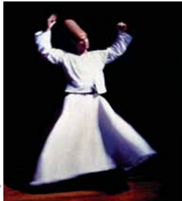
Ta'anga © Hasim Polat