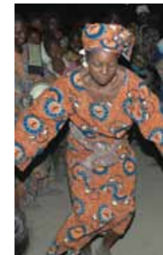
Ta'anga © UNESCO / Wes Parifak Koffi

Oíve ambue joavy estado-kuéra ndive; oí omoingéva inventario-pe patrimonio cultural oúva indígena tẽrã ijypykuéra reko año; Béljica ha Estgados Unidos katu omoinge avei pypekuéra tapicha ovava'ekue pype Tekopy tee ojehechakuaa'yva. Umi Estado oíhápe hetaichagua teko nomotenondéi umi imbarete ha ojepysovéva hyepýpe, ojapyhyve uvei umi tapicha aty imbovyvéva Tekopy tee ojehechakuaa'yva ha ombokuatia.