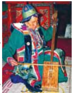
Ta'anga © Centro Nacional Mongol del Patrimonio Cultural