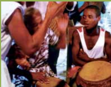
☞ El espacio cultural del Palenque de San Basilio, Colombia

región yma guive oiko haguéipe umi komunida heko ha iñe'ë peteíva.