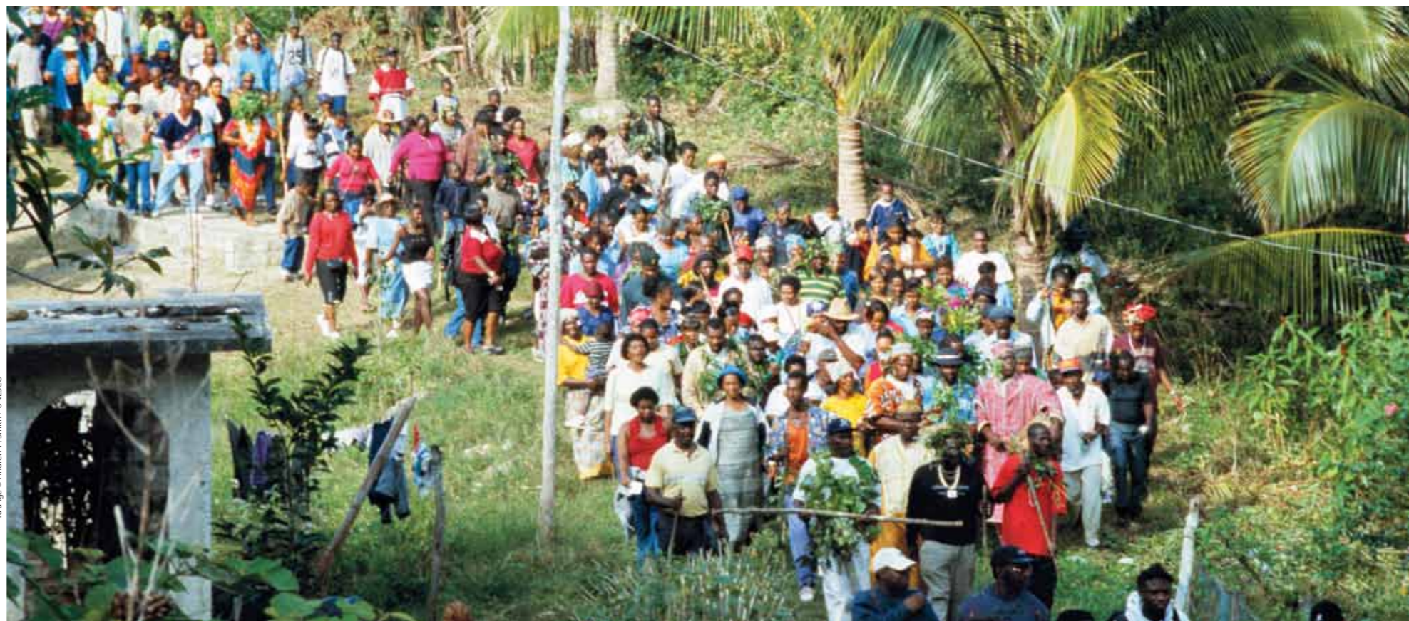
Ta'anga © Andrew P. Smith / UNESCO

Opavave tetã nunga ndorekói léi omo'ã haġua derécho orekóva komunidaduéra hembiporu, upéichante avei oñangareko haġua umi mba'ejára derécho, iñarandukuéra ha heko atyháicha rehe. Péicha ohechauka tekotevẽha oñeñantende ojeporu ha oñemyasã haġua