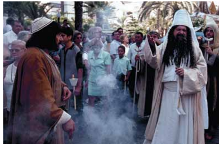
Ta'anga © Jaime Bratons