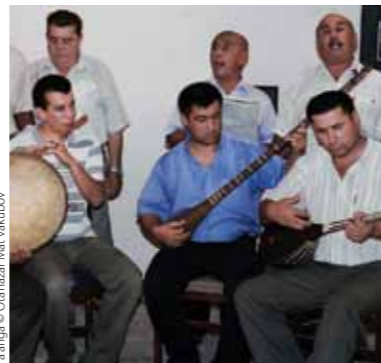
Ta'anga © Otanazar Mat Vakubov

Umi inventario oñembosako'íva ningo ndahasýi oñembyapu'apa haġua peteí tẽrã hetave ámbito ohakã'í'óva Convención-pe: "pohã yma" ha "myama indígena-kuéra arandu" ikatu oñembyaty "arapy rehegua mba'ekuaa" ryepýpe; "ñembosará" ha "tetãygua organización" katu oñemoingekuaa "tetãygua mba'eporu" apytépe. Mombe'ugua'u ha tenda, mba'ekuéra ha mymbakuéra réra oñemoigepakuaa "ayvu" apytépe, ha ñembo'ekuéra ha peregrinación umíva katu "rituales" tẽrã "actos festivos" kuápe. "Memoria" ha "jerovia", "marandu moõguipa jaju" tẽrã "tembi'u rehegua arandu" ikatu oikopa ámbito oñe'ẽva Convención Artículo 2-pe. Umi joavy ojejuhúva ámbito-kuérape ohechauka jeyvéramo mba'éichapa tapichakuéra yvy tuichakue javeve napeteíchai omomba'e patrimonio cultural, ha'e ko'ã mba'e ndojoavýi Convención ojerurévagui, Estado-kuéra ombosako'í pe inventario ojekupytyva iku'are