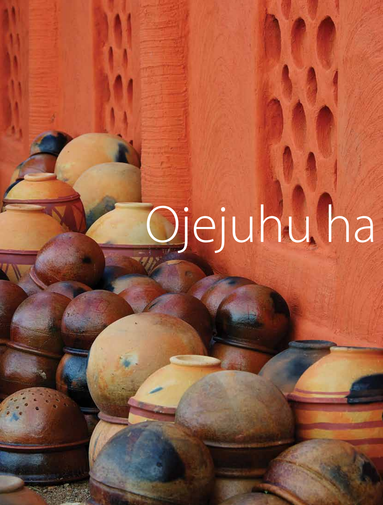
El patrimonio oral y las manifestaciones culturales del pueblo zápara, Ecuador y Perú