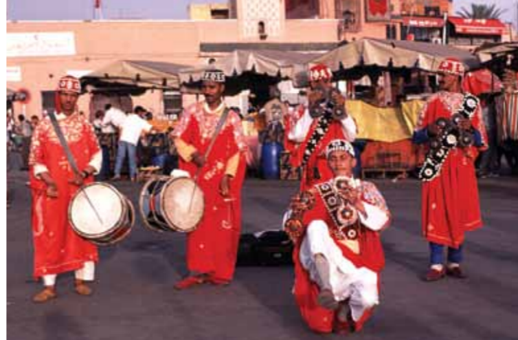
Ta'anga © UNESCO / Jane Wright

Terarysí oñembosako'íva ningo tuicha mba'e Tekopy tee ojehechakuaa'yva ñangarekorã, ikatútare ohechakuaa maymavépe tuicha mba'ehahína, ha tekotevêha oñemombarete tapichakuéra peteĩteí téra atyháicha heko añetévo. Oñembokuatia ramo umi patrimonio ha oñemoĩ maymave pópe ikatu avei oipytyvõ umi komundaygua ojerovianévo ijehe ha omoheñovévo hetahetave mba'epyahu ha mba'ejeporu patrimonio rehegua. Upéva ári avei umi terarysí oñembokuatiava'ekue ikatu oipytyvõ marandúramo oñemohenda hağua tembiaporã hekópe oñeñangareko potávo umi Tekopy tee ojehechakuaa'yva oñembokuatiáva.