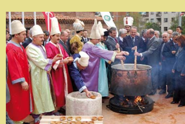
TURQUIE – Les festivités du Mezir Macunu