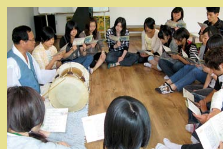
RÉPUBLIQUE DE CORÉE – L'Arirang, chant lyrique traditionnel en République de Corée