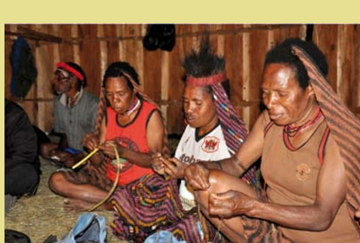
INDONÉSIE – Le Noken, sac multifonctionnel noué ou tissé, artisanat du peuple de Papouasie