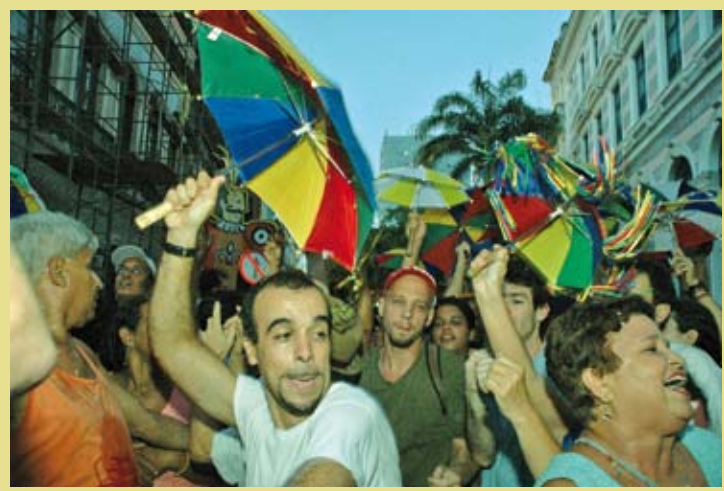
BRESIL – Le frevo, arts du spectacle du Carnaval de Recife