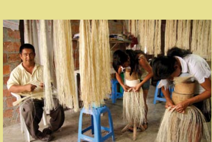
ÉQUATEUR – Le tissage traditionnel du chapeau de paille toquilla équatorien