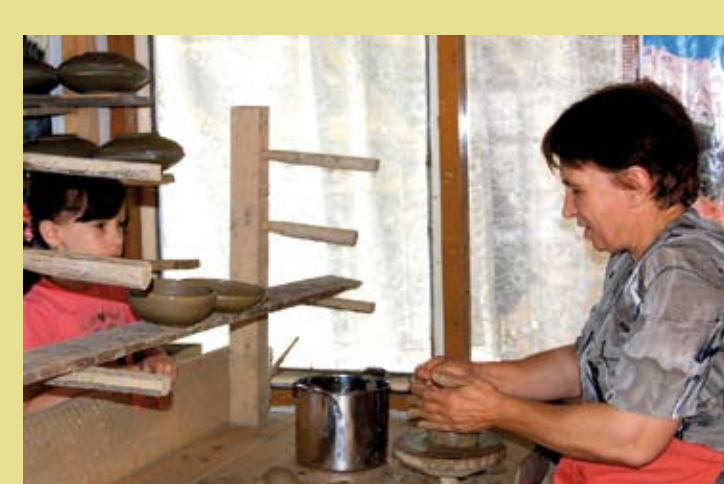
ROUMANIE – Le savoir-faire de la céramique traditionnelle de Horești © 2011, Centre national pour la préservation et le promotion de la culture et du patrimoine national, Photographie : Corina Hădărean