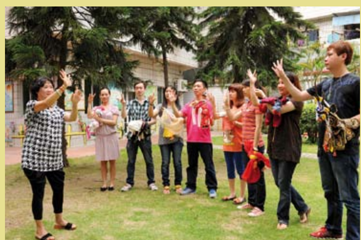
CHINE – La stratégie de formation des futures générations de marionnettistes du Fujian