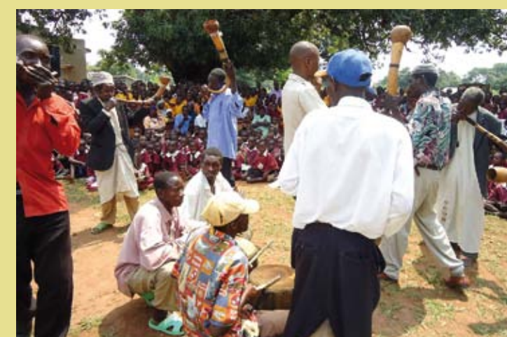
OUGANDA – Le bigwala, musique de trompes enalebasse et danse du royaume du Busoga en Ouganda