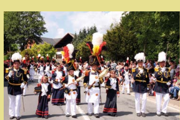
BELGIQUE – Les marches de l'Entre-Sambre-et-Meuse