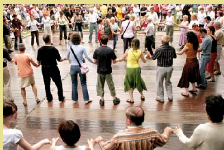
FRANCE – Le fest-noz, rassemblement festif basé sur la pratique collective des danses traditionnelles de Bretagne