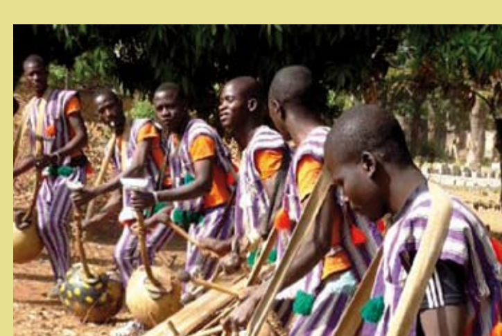
MALI, BURKINA FASO ET CÔTE D'IVOIRE – Les pratiques et expressions culturelles liées au balafon de communautés sénégalaises du Mali, du Burkina Faso et de Côte d'Ivoire