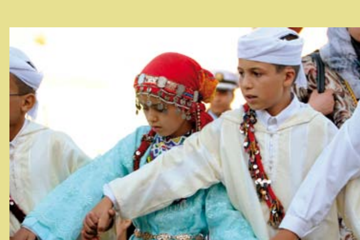
MAROC – Le festival des cerises de Sefrou