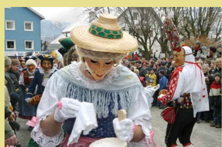
AUTRICHE – Schemenlaufen, le carnaval d'Innsbruck