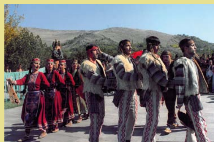
ARMÉNIE – L'interprétation de l'épopée arménienne « Les enragés de Sassoun » ou « David de Sassoun »