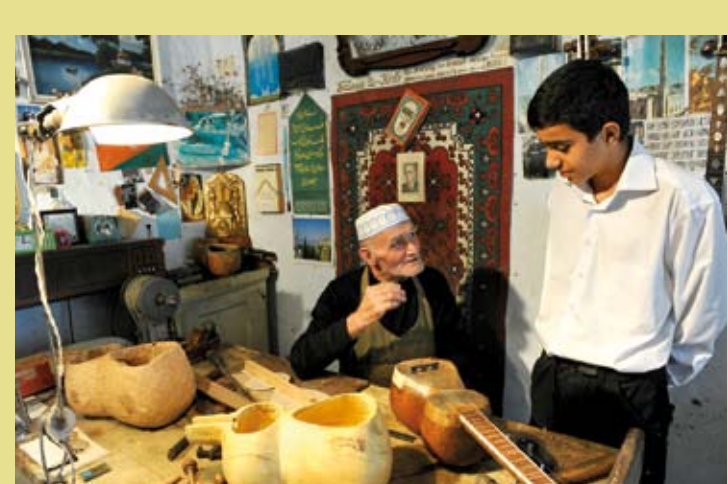
AZÉRBAÏDJAN – La facture et la pratique musicale du tar, instrument à cordes à long manche