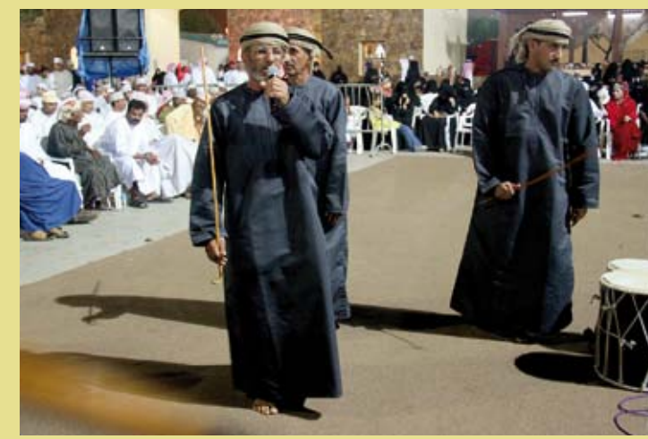
OMAN – Al'ari, élégie, marche processionnelle et poésie © 2009, Ministère du patrimoine et de la culture, Photographie : Muhammad al-Shabri