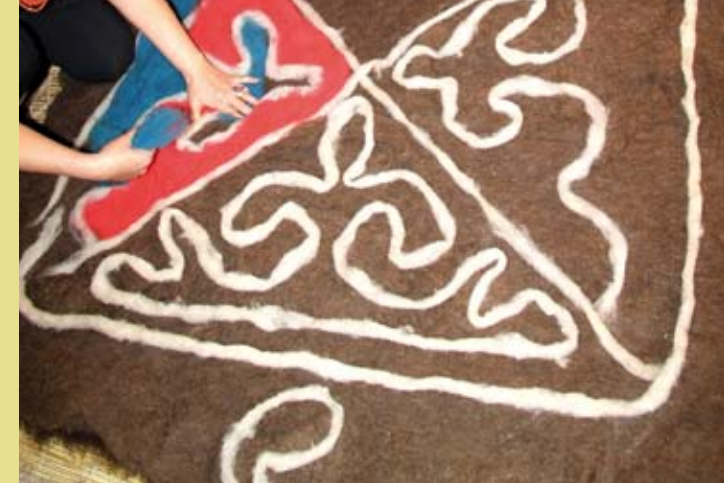
KIRGHIZISTAN – L'ala-kiyas et le chirdak, l'art du tapis traditionnel kirghis en feutre