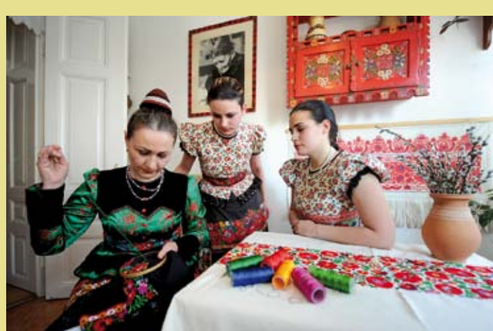
HONGRIE – L'art populaire des Matyó, la broderie d'une communauté traditionnelle