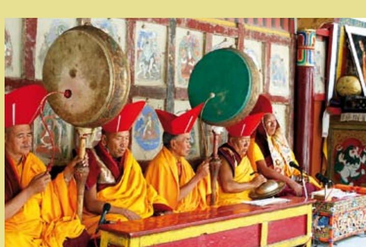
INDE – Le chant bouddhique du Ladakh : récitation de textes sacrés bouddhiques dans la région transhimalayenne du Ladakh, Jammu-et-Cachemire, Inde