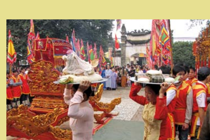
VIET NAM – Le culte des rois Hùng à Phú Thọ