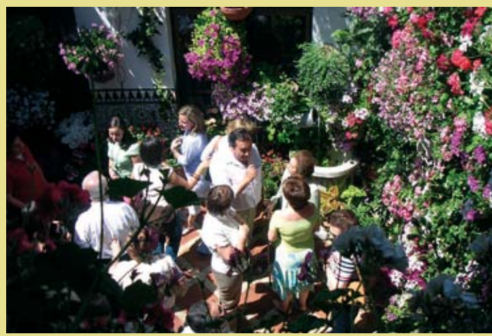
ESPAGNE – La fête des patios de Cordoue