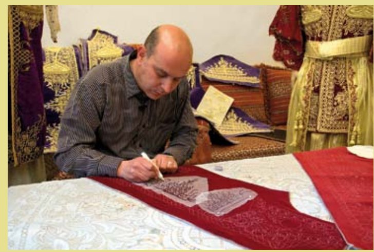
ALGÉRIE – Les rites et les savoir-faire artisanaux associés à la tradition du costume nuptial de Tlemcen