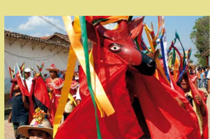
BOLIVIE (ÉTAT PLURINATIONAL DE) – L'Ichapekene Fiesta, la plus grande fête de Saint Ignace de Moxos