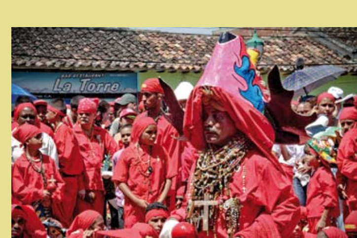
VENEZUELA (RÉPUBLIQUE BOLIVARIENNE DU) – Les diables danseurs de Corpus Christi du Vénézuéla