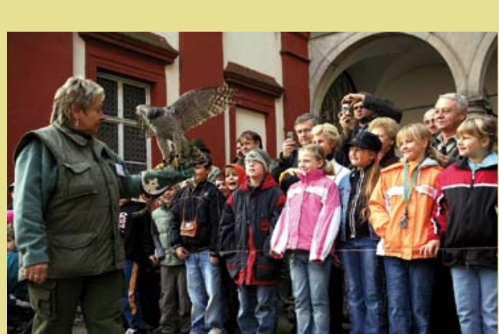
ÉMIRATS ARABES UNIS, AUTRICHE, BELGIQUE, RÉPUBLIQUE TCHÈQUE, FRANCE, HONGRIE, RÉPUBLIQUE DE CORÉE, MONGOLIE, MAROC, QATAR, ARABIE SAOUDITE, ESPAGNE ET RÉPUBLIQUE ARABE SYRIENNE – La fauconnerie, un patrimoine humain vivant