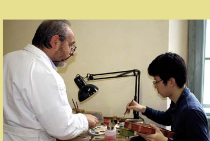
ITALIE – Le savoir-faire traditionnel du violon à Crémone © 2010, Terra d'Ombra Production, Photographie : Marcello Pizzi