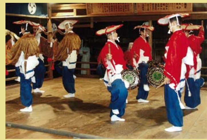
JAPON – Le Noh ou Dengaku, art religieux du spectacle pratiqué lors de la fête du feu de Noh