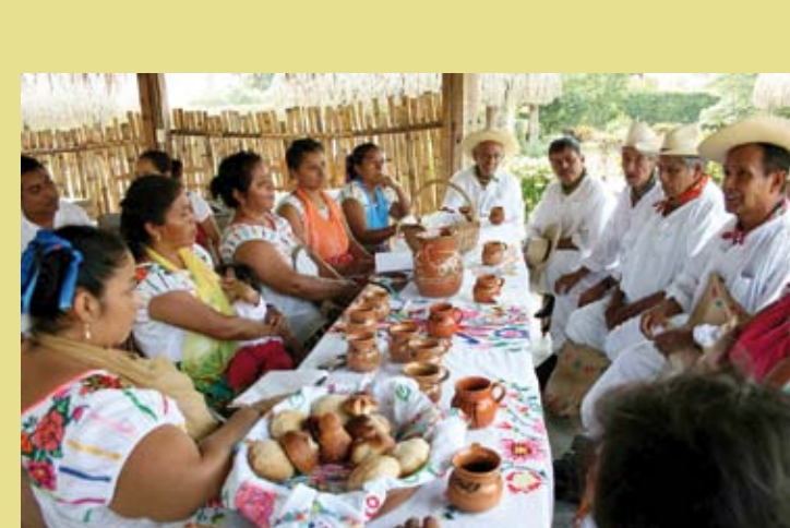
MEXIQUE – Xtasgagket Makgakxlawana : le Centre des arts autochtones et sa contribution à la sauvegarde du patrimoine culturel immatériel du peuple totonaque de Veracruz, Mexique