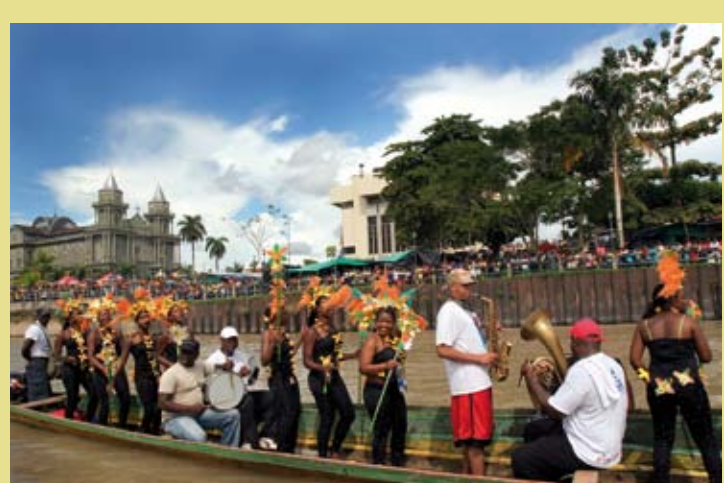
COLOMBIE – Le festival de Saint François d'Assise, Quibdó