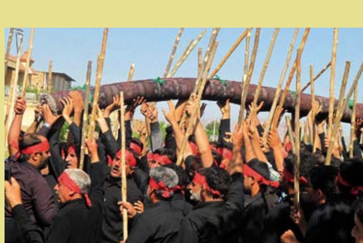
IRAN (RÉPUBLIQUE ISLAMIQUE D') – Les rituels Qāliūyān de Mashād-Ardehāl à Kāshān