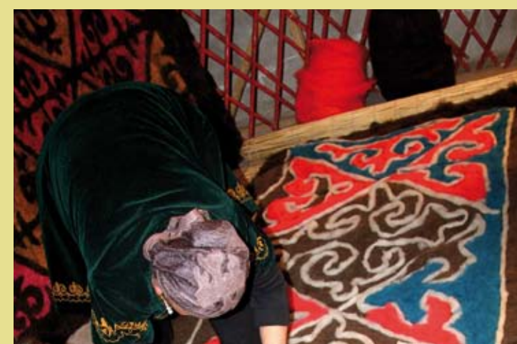
KIRGHIZISTAN – L'ala-kiyas et le chirdak, l'art du tapis traditionnel kirghis en feutre