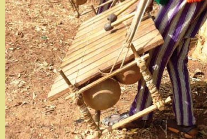
MALI, BURKINA FASO ET CÔTE D'IVOIRE – Les pratiques et expressions culturelles liées au balafon de communautés sénégalaises du Mali, du Burkina Faso et de Côte d'Ivoire