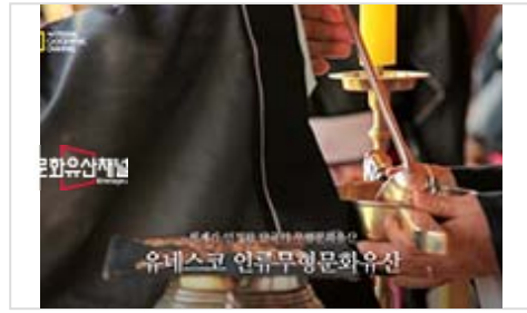
[한국의 세계유산 홍보영상] 제3편 한국의 유네스코 인류무형문화유산