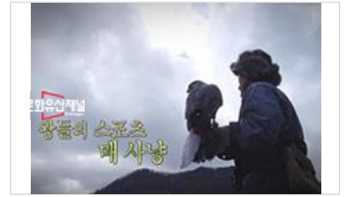
왕들의 스포츠 매사냥