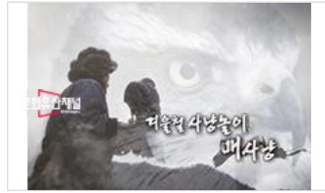
[정은표] 05편 겨울철 사냥놀이, 매사냥