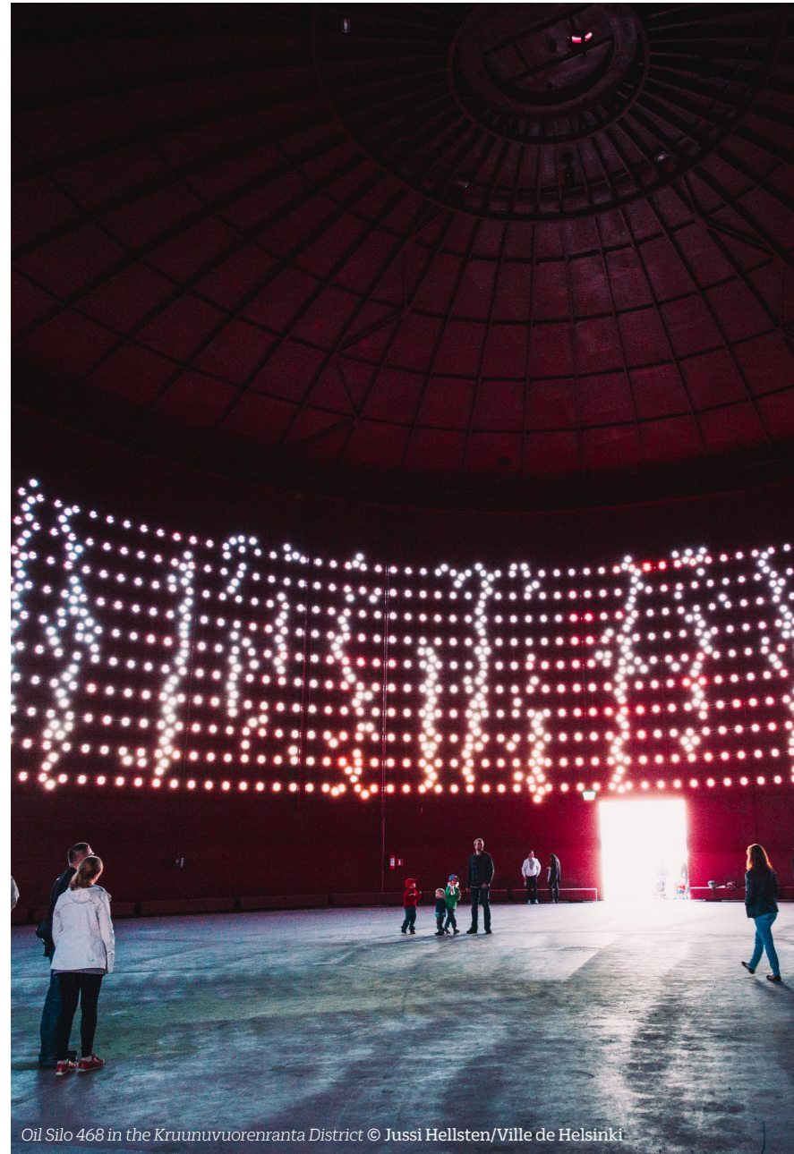
Oil Silo 468 in the Kruunuvuorenranta District