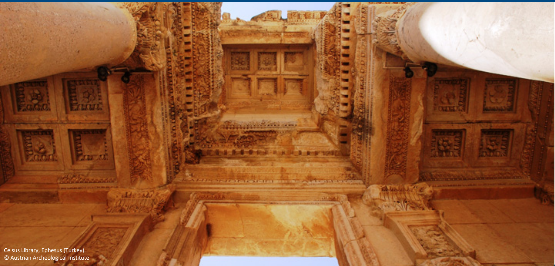
Celsus Library, Ephesus (Turkey).