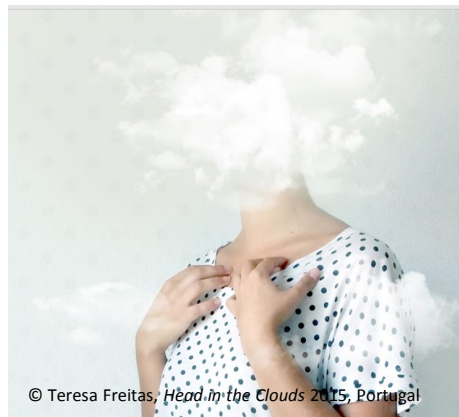
© Teresa Freitas, Head in the Clouds 2015, Portugal