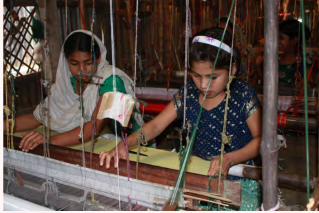
© २०१२ किराँज मोहम्मद -फोटो: मुसिद अमर

अन्तर्राष्ट्रिय कानूनी औजारहरू उपयोगी-सन्दर्भ सामाग्री हुनसक्छन् । यसका अतिरिक्त, नीति बनाउने कार्य समावेशी र प्रभावकारी हुनकालागि, राज्यको भूभागमा रहेका लैङ्गिकतासँग सम्बन्धित अभ्यासहरूको विविधतालाई ध्यानमा राख्नु आवश्यक हुन्छ ।