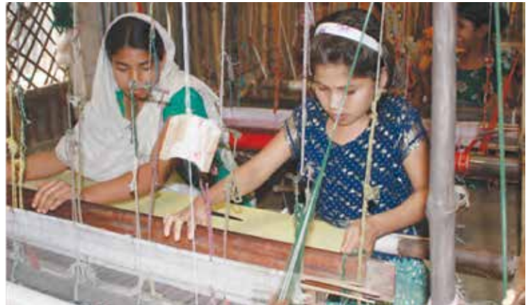
© 2012 by Firoz Mahmud – Photograph: Murshid Anwar

религиозной, языковой и гендерной дискриминации” (Оперативное руководство, 102). Международные документы, касающиеся гендерного равенства - такие как Конвенция о ликвидации всех форм дискриминации в отношении женщин и его Факультативный протокол 4 - могут послужить в качестве полезных источников информации. Помимо этого, для того, чтобы разрабатываемая политика была всеохватывающей и эффективной, она должна учитывать многообразие гендерных традиций, которое существует на территории государства.