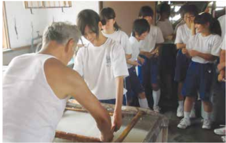
© 2013 Agency for Cultural Affairs

Для того, чтобы политика в области нематериального культурного наследия основывалась на взаимосвязи гендерного вопроса и нематериального культурного наследия, политика по охране наследия должна гарантировать участие различных сторон, в том числе соответствующих гендерных групп. Потенциально рискованной будет мера, которая доверит разработку политики по охране наследия лишь нескольким членам сообщества, сторонним экспертам или же государственным учреждениям. Также, при разработке политики следует учитывать меры, которые укрепляют права человека (включая гендерное равенство), способствуют устойчивому развитию и взаимоуважению при охране нематериального культурного наследия в соответствии с Конвенцией (статья 2.1). Помимо этого, при разработке политики следует учитывать меры, которые гарантируют, что информационно-просветительская деятельность не будет “оправдывать какую-либо форму политической, социальной, этнической,