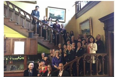
Dir/ODG/GE et les participants distingués du Forum