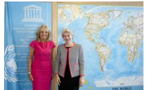
Dr Jill Biden et la DG lors du lancement de l'initiative TeachHer