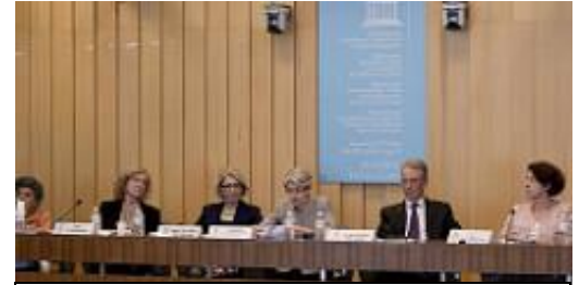
La DG donnant le discours de clôture lors de la Conférence

de la participation politique des femmes dans ces deux pays. Lors de cette conférence, les partenaires locaux, des experts ainsi que des acteurs de la société civile se sont réunis pour discuter des résultats que ces recherches ont dégagés. La Directrice générale a donné le discours de clôture ou elle a soulevé le long chemin qu'il reste à faire pour parvenir à la pleine participation des femmes en politique. Un rapport de synthèse sera publié en Octobre 2016 pour présenter les principales conclusions et recommandations.