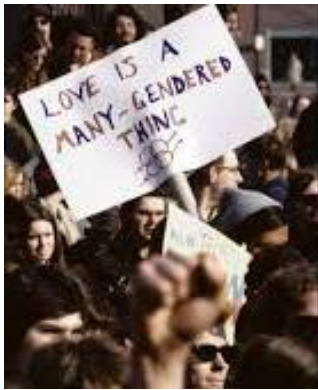
Une scène du documentaire Two Spirits

genres (non conformes aux normes de genre ordinairement admises dans