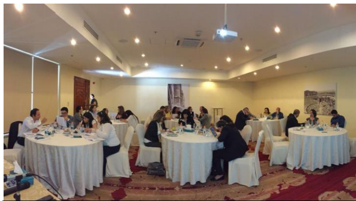
Les participants à la formation échangent des idées

En collaboration avec le Bureau d'Amman, la formation a été offerte à tous les membres du personnel des bureaux d'Amman et de l'Irak ainsi que des spécialistes de programmes sélectionnés des bureaux de Beyrouth, Doha et Ramallah. Au total, 47 membres du personnel ont participé à la formation à Amman, y compris les directeurs/chefs de bureau d'Amman (et l'Irak), Doha et Ramallah. Des sessions spéciales ont été aussi organisées pour les points focaux pour l'égalité des genres d'autres organismes des Nations Unies présents à Amman.