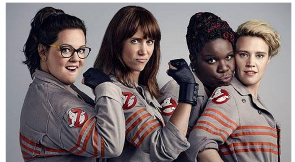
De gauche à droite : Melissa McCarthy, Kristen Wiig, Kate McKinnon and Leslie Jones

Le nouveau film S.O.S Fantômes ( Ghostbusters ) est un remake après la sortie de SOS Fantômes 2 ( Ghostbusters II ), un classique qui a vu le jour en 1989. La maison de production Sony a décidé de remplacer la distribution initiale entièrement masculine par une distribution entièrement féminine. La version de 2016 met en vedette Melissa McCarthy, Kristen Wiig, Kate McKinnon et Leslie Jones. Elles jouent les rôles principaux et interprètent des scientifiques et des ingénieurs plutôt que de jouer des personnages secondaires qui existent seulement pour l'intrigue romantique de l'histoire. La décision de proposer une distribution entièrement féminine a suscité une certaine controverse dans les médias. Cependant, ce film a également été acclamé pour son innovation par rapport aux rôles que les femmes jouent habituellement dans les films grand public. Ceci est une victoire pour le test Bechdel , présenté dans la dernière édition du GenderWire, qui mesure si une œuvre de fiction comporte au moins une scène dans laquelle