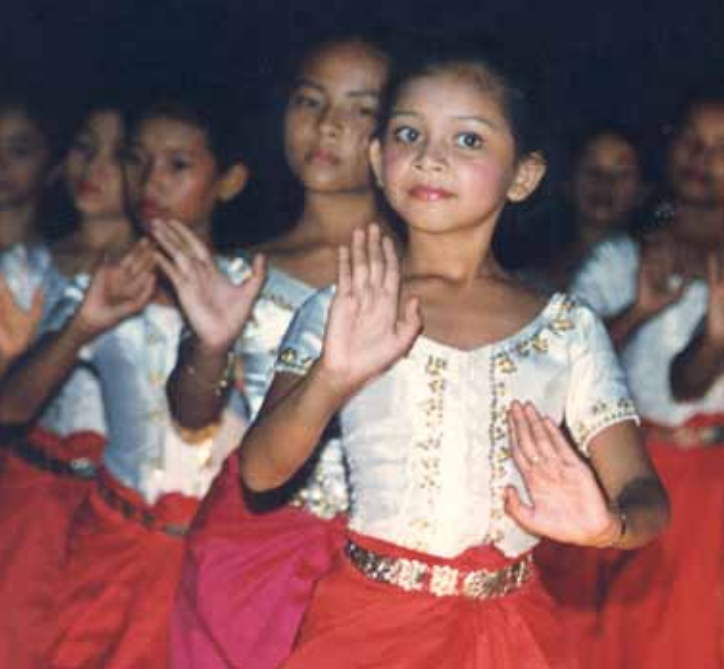
Ta'anga © Ministerio de Cultura y Bellas Artes