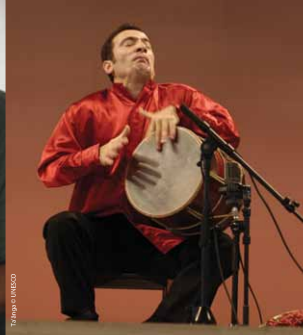
Ta'anga © UNESCO

natekotevëvoi ha na'iporai avave ointervenir oñeipysyrõ haguã tapichakuera rembikuaa arandu, jápoke ikatu oñembyai'imi komunidakuera rembikuaa. Upéicha avei, umi mba'e oñeipysyrõséva kuápe ojehechakuaa va'erã leikuera mimi ijykepegua, tapichakuera tekoatpegua ñõnte oikuaáva mba'éichapa omýi, umíva apytépe oihíva opáichagua tembajeroviapy hamba'e, upe komuniápende ojeikuaa ha ojeipurúva.