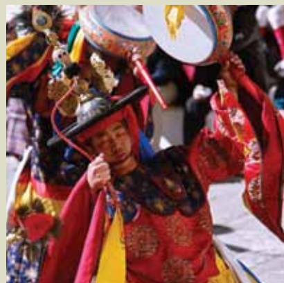
Ta'anga © Yoshi Shimizu/www.yoshishimizu.com