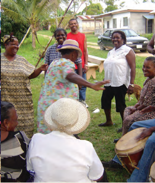
फोटो © नेशनल गरिफुना काउनसिल लाइवेज, डान्स र म्युजिक अफ द गरिफुना