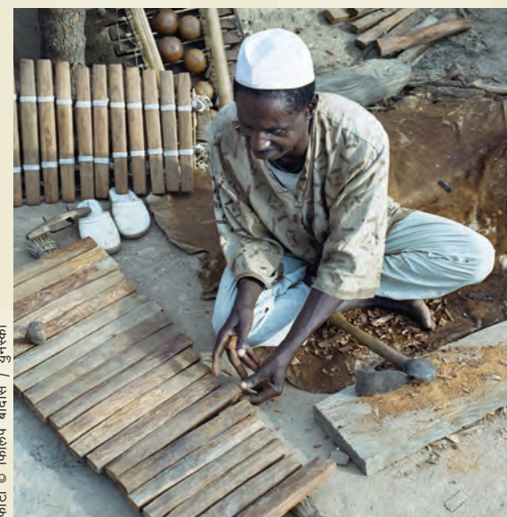
गिनियाको सोसो-बालाको सांस्कृतिक स्थल