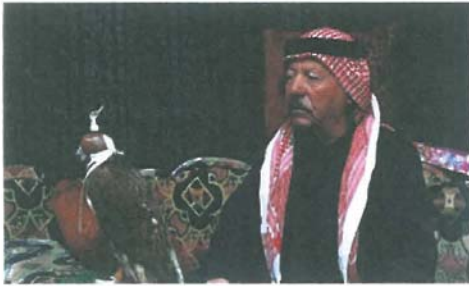
صيد الصقور، القائمة السورية للتراث