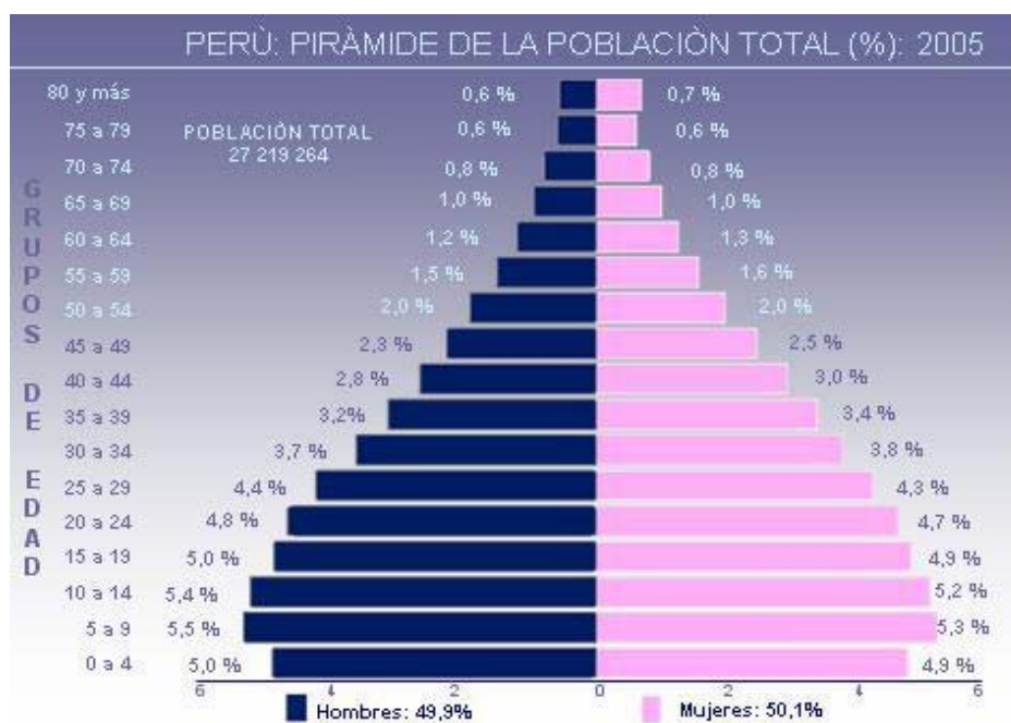
Gráfico 2. Población según género y edad