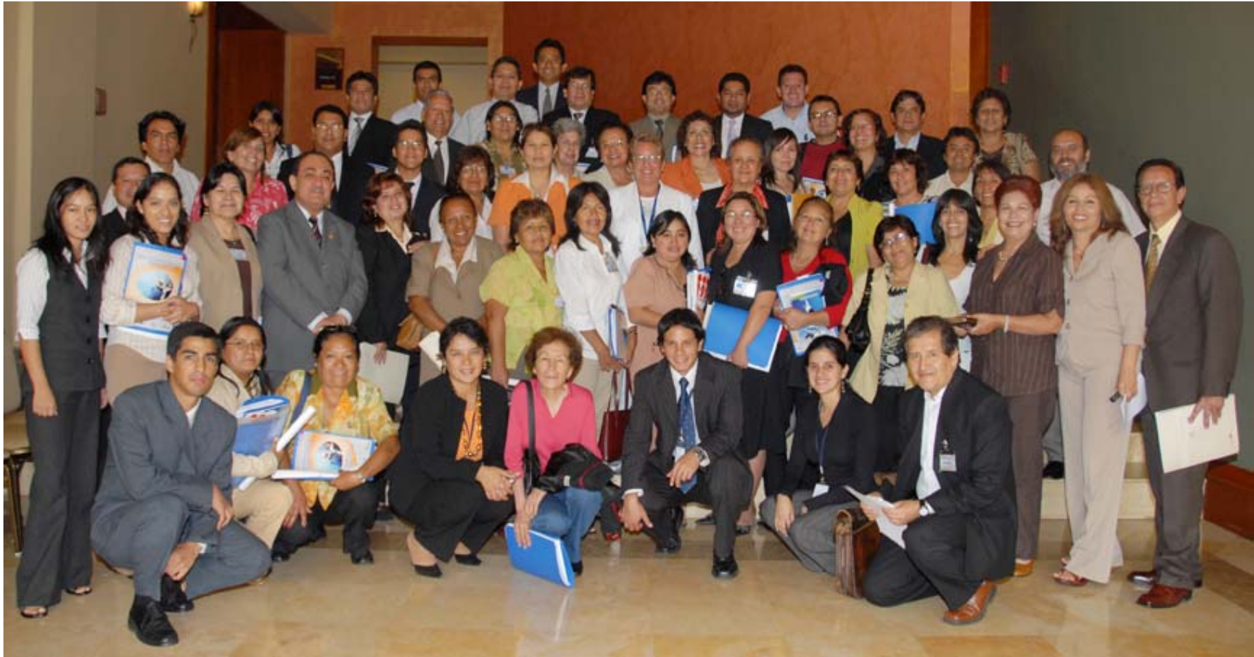
Participantes en el taller “Desarrollo y estado del Aprendizaje y Educación de Adultos: rumbo a la VI CONFINTEA”