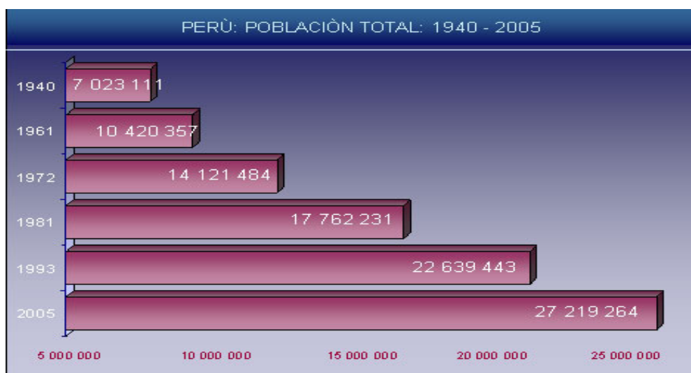
Gráfico 1. Población total de Perú

La población total en el Perú es de 27 millones 219 mil 264 personas , de las cuales el 50,1% son mujeres y el 49,9 % son hombres 6 , en el siguiente gráfico se puede apreciar la evolución de la población total de Perú en las últimas décadas.