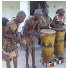
द एमवेण्डे जेरुसरेमा डान्स, जिम्बावे

कार्निभल डि बरान्चिवल्लाको मौलिकता जोगाउन तथा यसमा सहभागितालाई प्रोत्साहित गर्न एउटा स्थानीय फाउण्डेसन बनाइएको छ जसले बालबालिकाहरूको मेलामा सहयोग गर्दछ, जुन कोलम्बियामा प्रदर्शन गरिने रमिताहरूको महत्वपूर्ण तत्व बनेको छ । अभ्यासकर्ताहरूले भौँकी (floats), भड्किलो पहिरन, शीरमा लगाइने गहना, सांगीतिक बाजागाजा, जनावरका मुखौटाहरू र अन्य कलात्मक सामग्रीहरूलगायत हस्तकला सामग्रीहरूको उत्पादनका लागि आर्थिक सहयोग प्राप्त गरे । लघु-ऋण कार्यक्रमले कालिगढहरूका लागि सामग्रीहरू उत्पादन गर्न ससानो रकम पैसा सापट लिन र तिनलाई अतिरिक्त आम्दानीका लागि बिक्रि गर्नका लागि सम्भव भयो जसले गर्दा उनीहरूको जीवनको गुणस्तरमा सुधार आउनुका साथै रमितामा उनीहरूको सहभागिताको महत्वमा समेत थप जोड पुग्न गयो ।