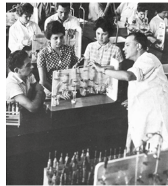
Años 60: UNESCO impulsa la política científica en América Latina