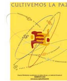
Década del 90: Del fomento de las actividades científicas y tecnológicas a la Cultura de Paz