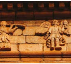
Comienzo de un nuevo siglo: se suma el Programa de Cultura

70 años trabajando en la región, hoy nos permiten contar con: