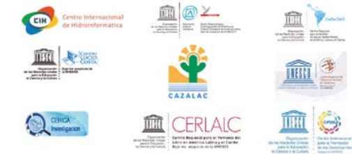
Promoción de redes regionales en Ciencia y Tecnología (RedCienA; RedFAC; RedPOP; RELAA; RELAB; RELACQ; RELACT, RedPOST)