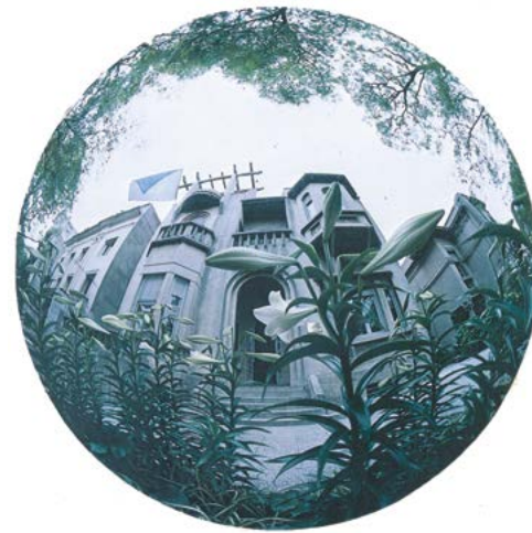
La década del 70: La descentralización y la consolidación de los grandes programas