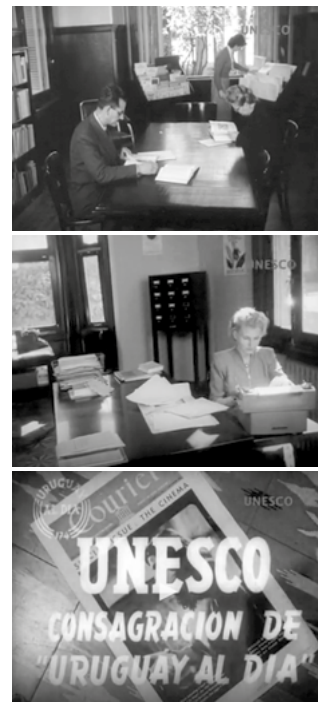
Los 50: Primeras acciones en la región

Hace 70 años, poco después de la creación de la UNESCO, con el impulso de un grupo de notables científicos de la región, nació el Centro de Cooperación Científica para América Latina (LASCO: Latin American Science Cooperation Office), con el objeto de promover y consolidar la ciencia en la región