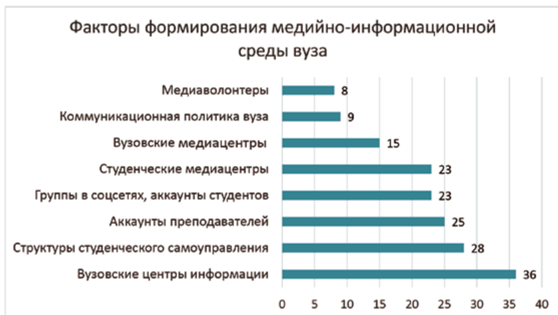
Рис. 2. Каким образом в вашем вузе формируется медийно-информационная среда?

Полученные результаты говорят о том, что в подавляющем большинстве университетов основными технологиями, с помощью которых формируется медийно-информационная среда, остаются традиционные и уже не очень эффективные – официальный сайт университета и вузовские средства информации. Несущественную роль в информационной системе вуза играют неформальные группы и аккаунты студентов и преподавателей, студенческие и вузовские медиацентры. Очень слабо развито такое направление деятельности как медиаволонтерство, которое может оказывать положительное воздействие как на формирование открытой медиасреды вуза, так и на повышение уровня МИГ самих студентов. Также остается открытым вопрос формирования эффективной коммуникационной политики.