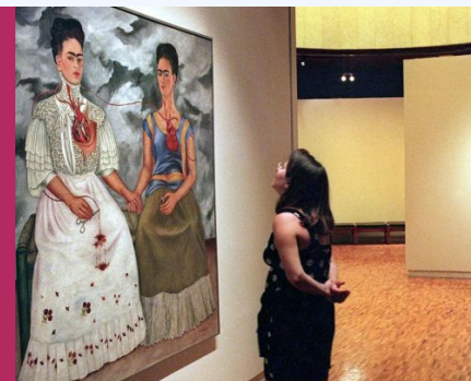
Fernando Botero, siji.life