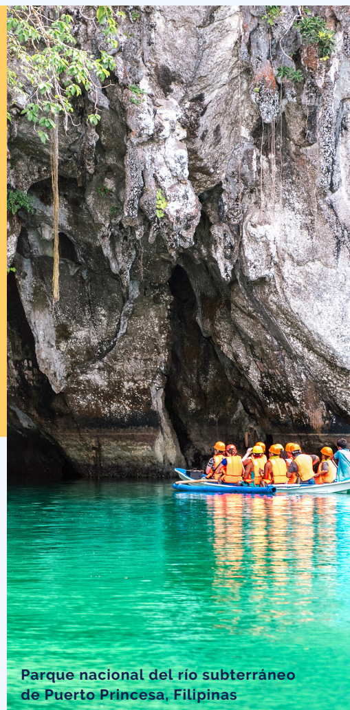
Parque nacional del río subterráneo de Puerto Princesa, Filipinas

Desafortunadamente, la pandemia ha interrumpido el trabajo a nivel internacional para proteger la biodiversidad y abordar el cambio climático. Este mes, la Unión Internacional para la Conservación de la Naturaleza, un órgano asesor de la Convención del Patrimonio Mundial de la UNESCO, debía celebrar su Congreso Mundial de la Conservación en Marsella ( Francia ), ahora pospuesto hasta 2021. Asimismo, la Conferencia Oceánica de las Naciones Unidas 2020, programado para este mes en Lisboa (Portugal), también ha sido pospuesto. Mientras tanto, el último año del Decenio de la ONU sobre Biodiversidad culminaría en octubre en Kunming ( China ), con la 15ª Conferencia de las Partes del Convenio sobre la Diversidad Biológica. Finalmente, la Conferencia COP 26, un importante seguimiento del Acuerdo de París sobre el cambio climático está programada para celebrarse en Glasgow ( Reino Unido ) en noviembre de 2021, un año tarde.