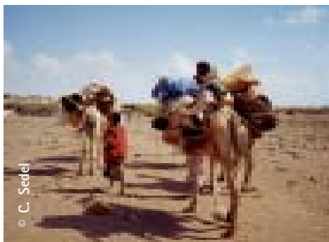
Levantando el campo en Djibuti

Las poblaciones nómadas forman parte, sin lugar a dudas, de los grupos sociales que menos acceso tienen a la educación. Ellas también constituyen el grupo cuya problemática ejemplifica mejor el conflicto entre tradición y modernidad. Frecuentemente se considera que las poblaciones nómadas forman parte de un universo aparte, cuya vida cotidiana está regida por la búsqueda permanente de agua y pastos para su ganado. A pesar de los esfuerzos de asimilación y sedentarización realizados en muchos países, los nómadas aún representan hoy en ciertas regiones del mundo, especialmente en África, una minoría de un peso demográfico nada despreciable. Sólo en el Cuerno de África, su número se calcula en alrededor de 10 millones de personas.