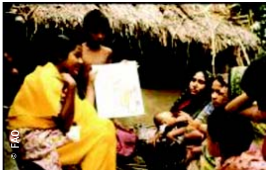
Mujeres bengalí aprenden sobre microcréditos en un programa de la FAO

EL mundo rural, que frecuentemente hace prueba de cierta inercia en términos de desarrollo económico, también sufre debido a una débil escolarización. A pesar de los esfuerzos realizados desde la década de los sesenta y la movilización de la comunidad internacional tras la declaración de la Conferencia de Jomtien en 1990, las áreas rurales de muchos países en desarrollo todavía son los “parientes pobres” en lo que se refiere a la educación. A menudo se descuida el hecho de que el lento ritmo de progreso hacia la universalización de la educación básica se debe en gran medida a la persistencia de bajas tasas de matrícula en las áreas rurales. El problema de las desigualdades sociales y, por consiguiente, de las desigualdades de género, parecen haber oscurecido el persistente retardo en el acceso y la participación de los pobladores rurales en el sistema educacional.