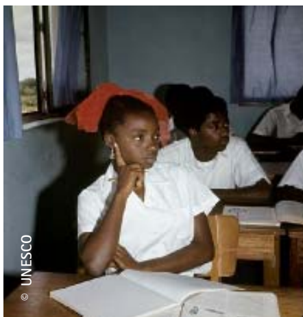
Formación de profesores en una universidad de Liberia

Jomtien, en marzo de 1990, y Dakar, en abril de 2000, no solo situaron a la Educación para Todos (EPT) en el primer plano de la formulación de política nacional, sino que ayudaron especialmente a renovar la visión de la educación básica para todos. Construir alianzas y movilizar recursos, las líneas de acción desarrolladas en Jomtien y Dakar, apelan a reconsiderar los papeles y funciones específicos de todos los socios institucionales en la promoción de la EPT. Sin embargo, las instituciones de educación superior a menudo no son percibidas como socios prioritarios. Por consiguiente, las autoridades nacionales de muchos países, así como de la comunidad de proveedores de fondos, se plantean preguntas relacionadas con el papel que desempeña o podría desempeñar potencialmente la educación superior en el esfuerzo destinado a lograr la EPT, individualmente o en colaboración con otros actores.