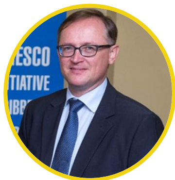
YURI PESHKOV UNESCO

Yuri Peshkov es Especialista del Programa de Cultura de la Oficina Multipaís de la UNESCO para el Caribe en Kingston, Jamaica, desde marzo de 2016. Como parte de sus funciones, Yuri participa en la implementación de las Convenciones de Cultura de la UNESCO, incluidas las dedicadas a proteger y salvaguardar el Patrimonio Mundial y el Patrimonio Vivo, prevenir el Tráfico Ilícito de Bienes Culturales, así como promover la Diversidad de Expresiones Culturales en el Caribe de habla inglesa y holandesa. Su trabajo se centra principalmente en la promoción de la cultura para el desarrollo sostenible y la protección de la diversidad cultural a través de la implementación de proyectos operativos y normativos integrados.