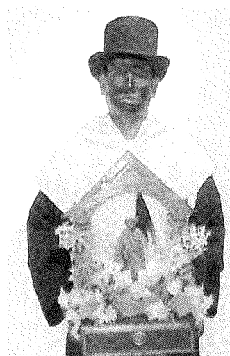
4.- Cargador del santo Instituto del Patrimonio Cultural, 2009