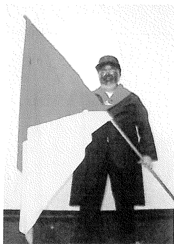
3.- Abanderado Instituto del Patrimonio Cultural, 2009