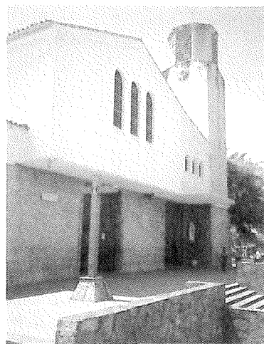
2.- Iglesia parroquial de La Santísima Cruz Instituto del Patrimonio Cultural, 2009