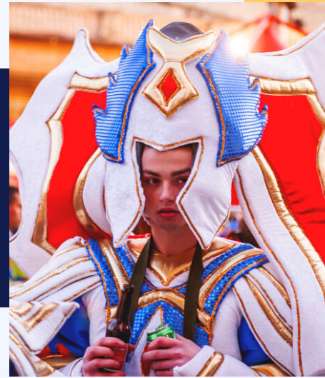
La Valeta, festival tradicional nocturno de Malta.

Llamado a contribuciones de CIOFF para compartir videos de eventos culturales y festivales (12 de abril)