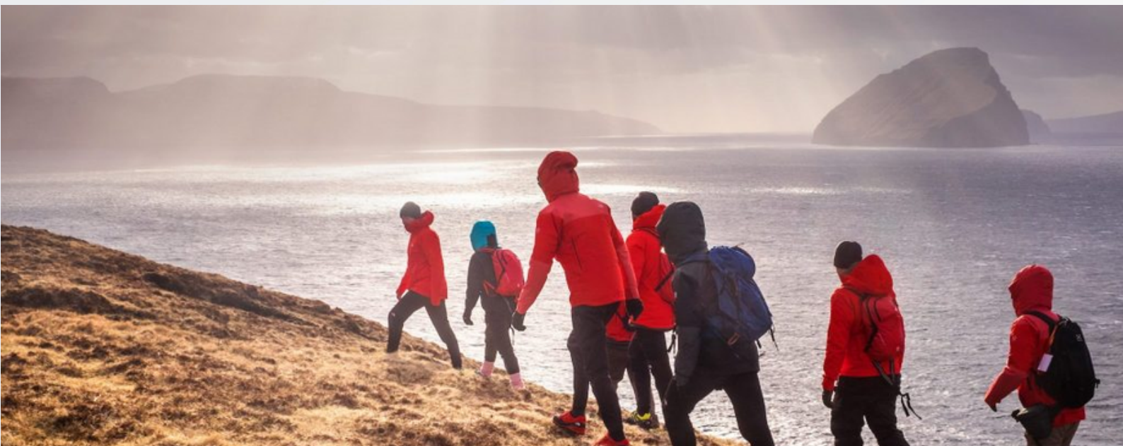
Foto: Islas Feroe. A comienzos de este año los principales sitios turísticos del archipiélago fueron cerrados a causa de la interrupción de sus actividades. Visite Islas Feroe

Músicos de Barbados, San Cristóbal y Nieves, Trinidad y Tobago y Sint Maarten han contribuido a la plataforma digital "Reto de Cuarentena Extempo" para compartir videos de música calipso para crear un sentimiento de unidad y mensajes de salud pública