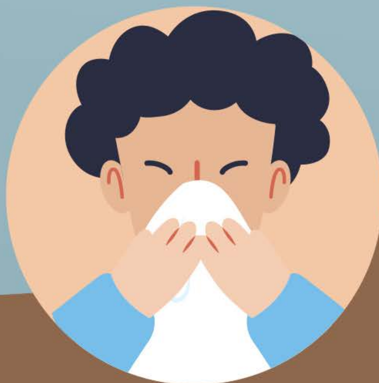
ճիշտ փռշտալ, հազալ