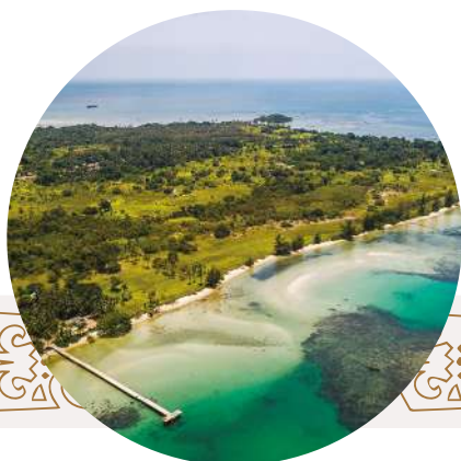
Belitong UGGp (Indonésie)

Parmi les 169 Géoparc Mondiaux de l'UNESCO existants, 10% sont basés dans de petites îles où ils jouent un rôle essentiel pour la conservation et la promotion du patrimoine géologique, la sensibilisation au changement climatique, la participation de la population et l'établissement de nouvelles stratégies pour le géotourisme et le développement économique durable intégré.