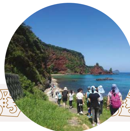
Les Îles Oki UGGp (Japon)

Sa superficie totale est de 2 500 km 2 , comprenant 866 km 2 de terres avec 151 000 habitants.