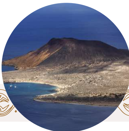
Lanzarote UGGp (Espagne)

4 800 km 2 sur terre et 13 000 km 2 de zone maritime, avec une population de 288 771 personnes.