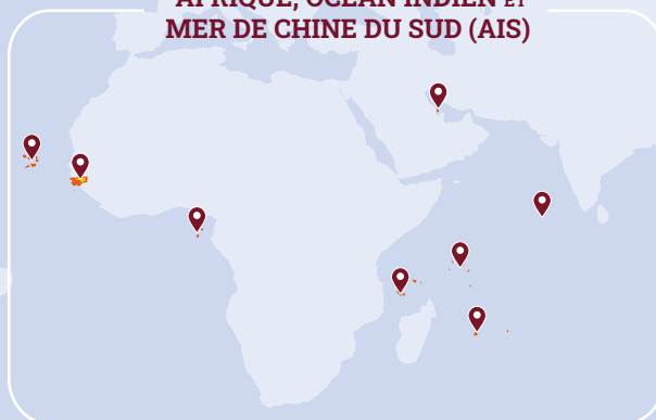
AFRIQUE, OCÉAN INDIEN ET MER DE CHINE DU SUD (AIS)