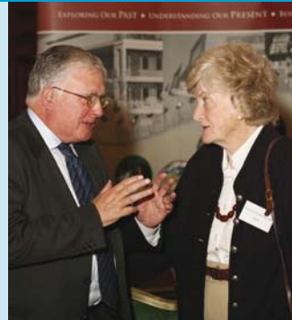
Rannpháirtithe ag Seimineár Comhairliúcháin um Plean Straitéiseach ÚAO 25ú Deireadh Fómhair 2006.