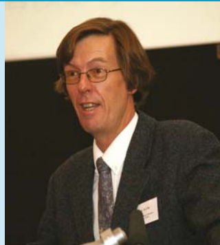
An tUas. Jon File ag labhairt leis na rannpháirtithe ag an Seimineár Comhairliúcháin ar Phlean Straitéiseach an ÚAO, 25ú Deireadh Fomhair 2006.