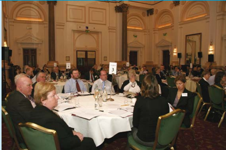
Rannpháirtithe ag Seimineár Comhairliúcháin um Plean Straitéiseach ÚAO 25ú Deireadh Fómhair 2006.