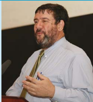
An tUas. Art Hauptman ag labhair leis na rannpháirtithe ag Seimineár Comhairliúcháin um Plean Straitéiseach ÚAO 25ú Deireadh Fómhair 2006.