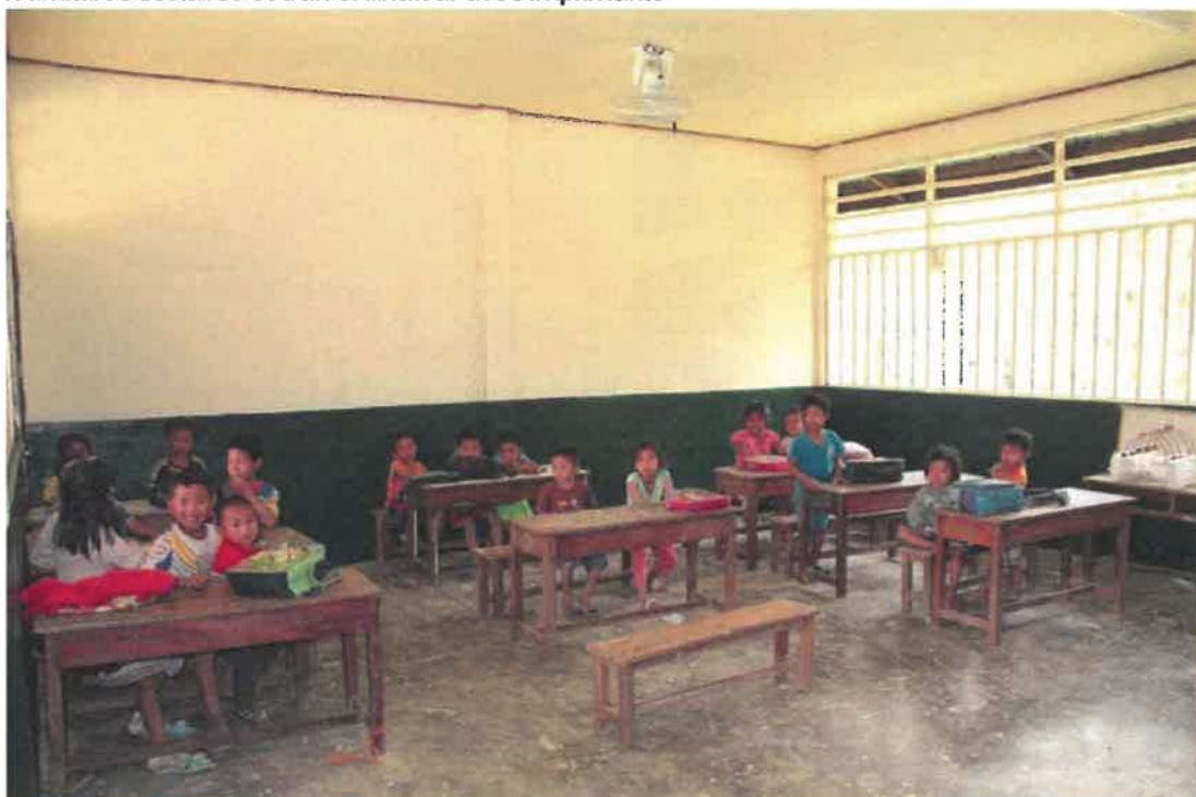
RAPPORT D'ACTIVITE 2017

Maison de Sagesse est intervenue à l'école de ce village isolé pour électrification des bâtiments scolaires avec installation de ventilateurs, réfection des plafonds et peinture des salles de classe, apport de fournitures scolaires et d'un ordinateur avec imprimante