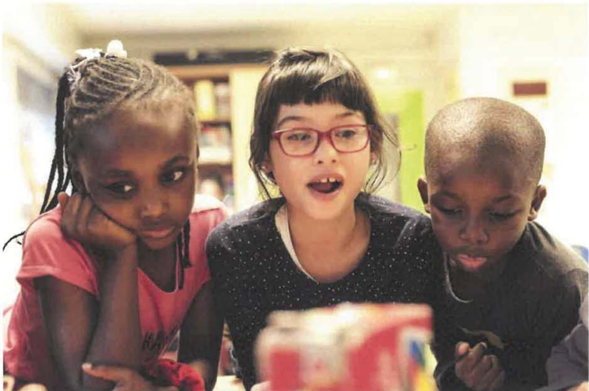
Les enfants d'un groupe de soutien scolaire, Paris

ONU , Statut consultatif ECOSOC UNESCO , Maison de Sagesse est accréditée en relations opérationnelles depuis 1998 FONDATION DU BENEVOLAT , Palmes d'or en 2001 COMMISSION DES DROITS DE L'HOMME , Mention spéciale en 2004 VOIX DE L'ENFANT , Maison de Sagesse est membre actif de la Fédération La Voix de l'Enfant