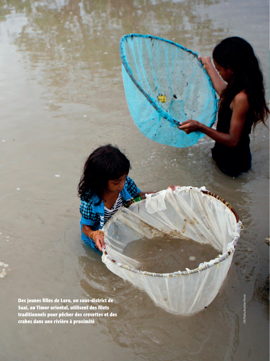
Des jeunes filles de Loro, un sous-district de Suai, au Timor oriental, utilisent des filets traditionnels pour pêcher des crevettes et des crabes dans une rivière à proximité